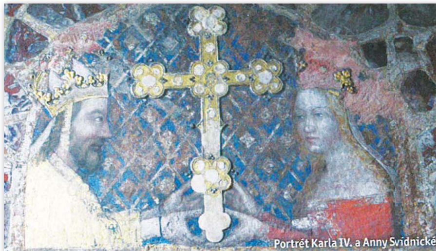
Portrét Karla IV. a Anny Svídnické