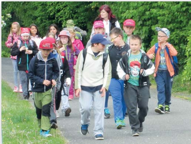
4. třída, 16.–20. května, Malá Skála