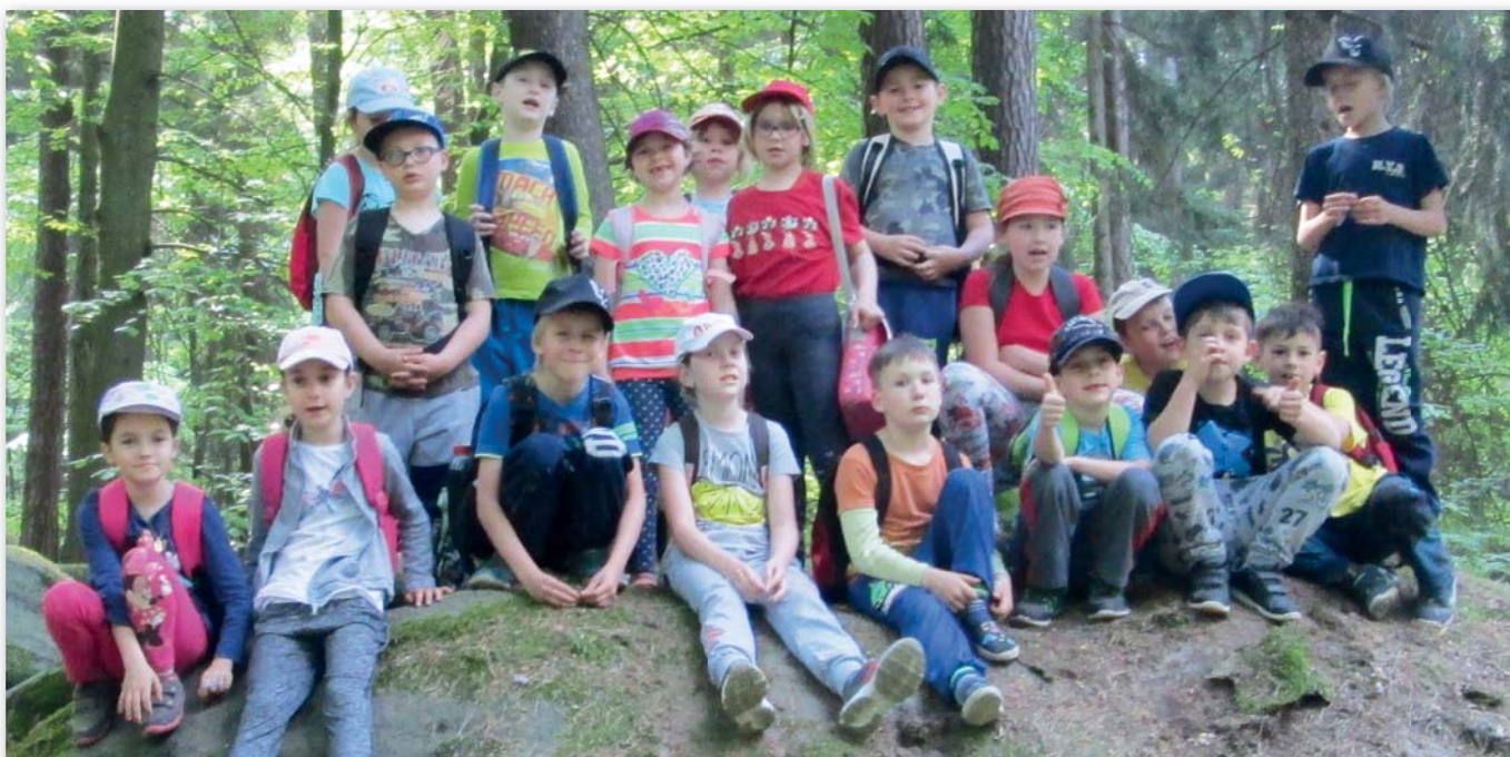
1. třída, 9.–13. května, Český ráj – Horní Lochovo