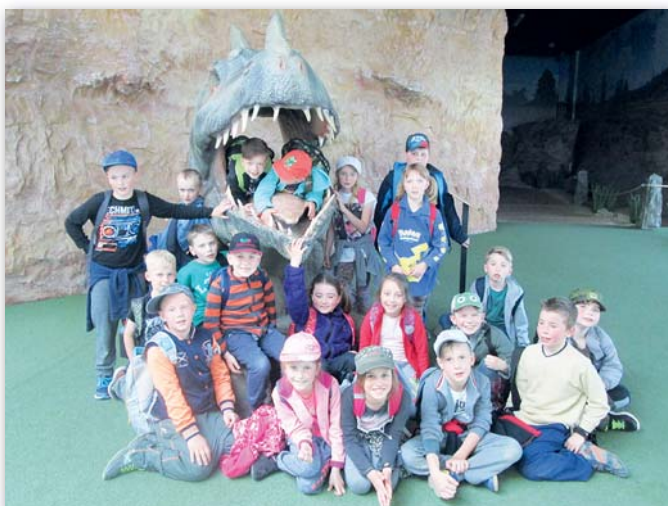
2. třída, 16.–20. května, Malá Skála