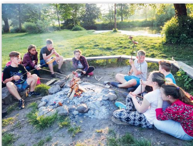
7. třída, 23.–27. května, Český ráj – Zrcadlová koza