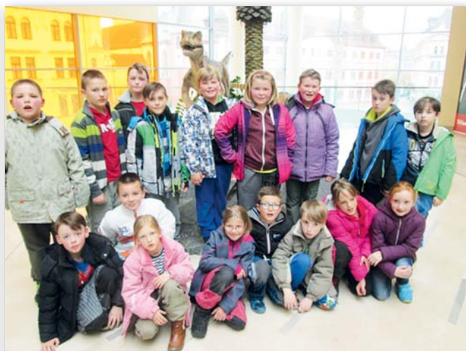
3. třída, 25.–29. dubna, Bedřichov v Jizerských horách