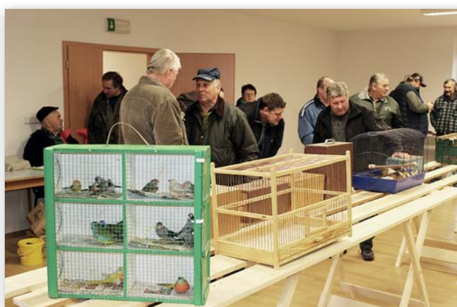
Od března probíhají ve Spolkovém domě každý měsíc trhy exotického ptactva a domácích zvířat, které se těší velkému zájmu chovatelů. Trhy budou pokračovat až do září