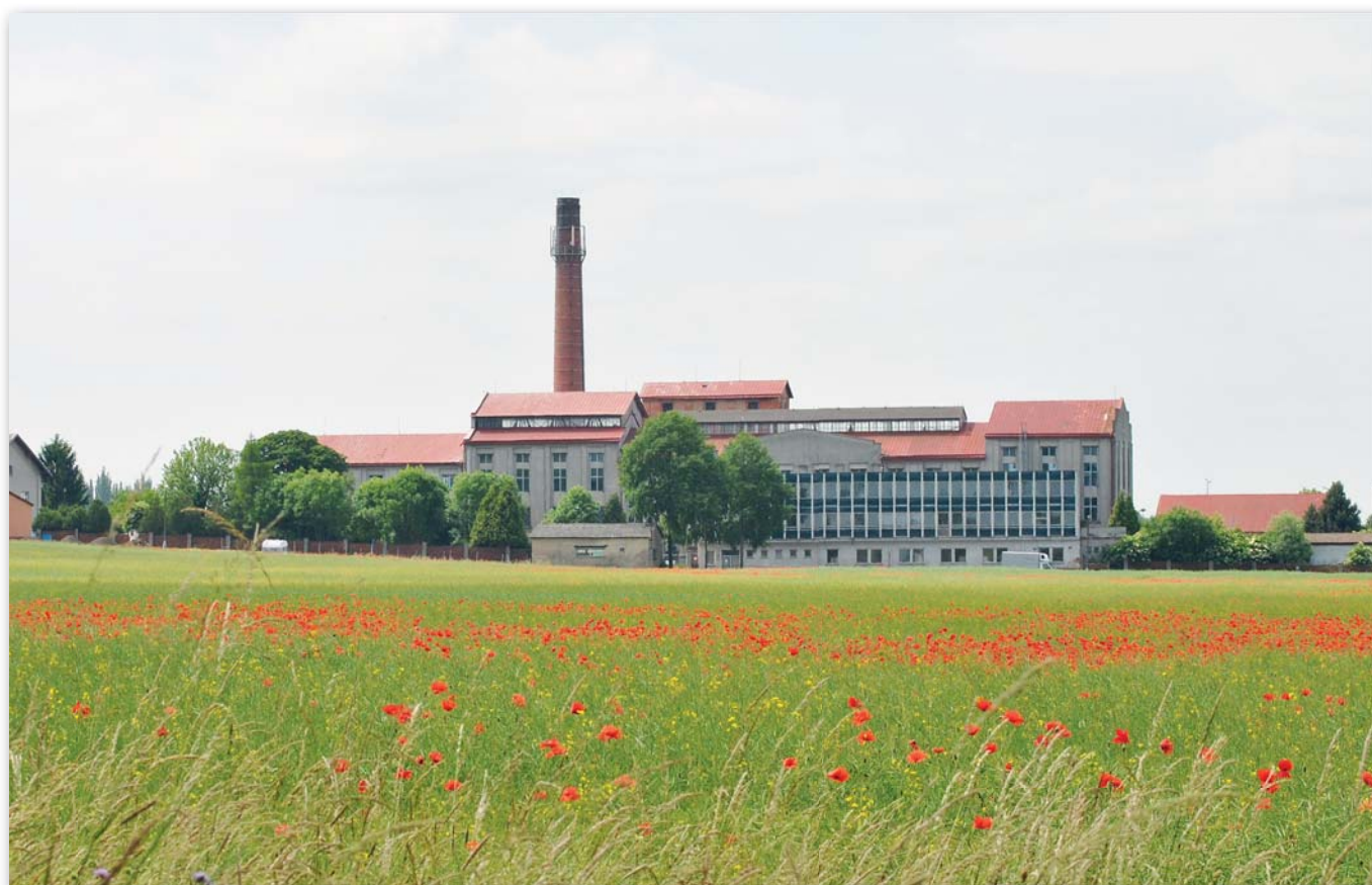
Současný pohled na budovu bývalého Strojbalu, fotografoval Viktor Dobrev (červen 2015)

Číslo 2/2016, ročník 5. Náklad: 350 ks. Evidenční číslo: MK ČR E 20643.