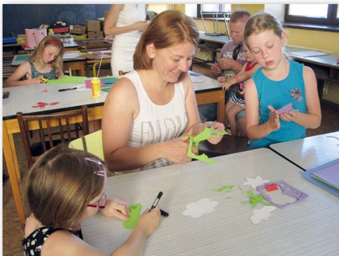
Dopoledne probíhaly v základní škole výtvarné dílny