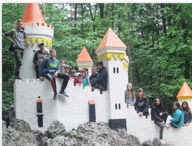
8. třída, 23.–27. května, Trpišov – Slatiňany