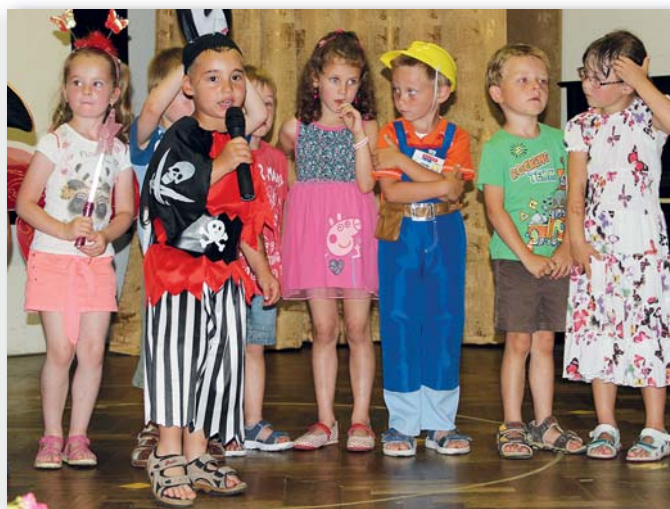
Odpoledne začalo Školní akademii v sále Radnice