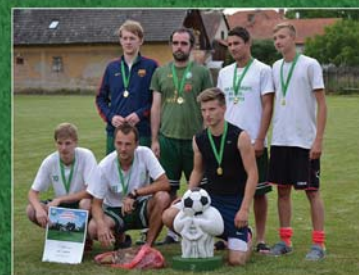
Roždalky vítěz 4. ročníku turnaje (2015)