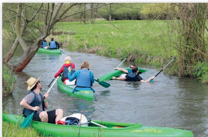
V neděli 17. dubna proběhlo pod Bučickým mlýnem u Rožďalovic tradiční Odemykání Mrliny. Akce se konala na propagaci stezky Greenway Mrlina: Nymburk – Kopidlno – Jičín s odbočkou na pramen Mrliny v Příkladu u Sobotky