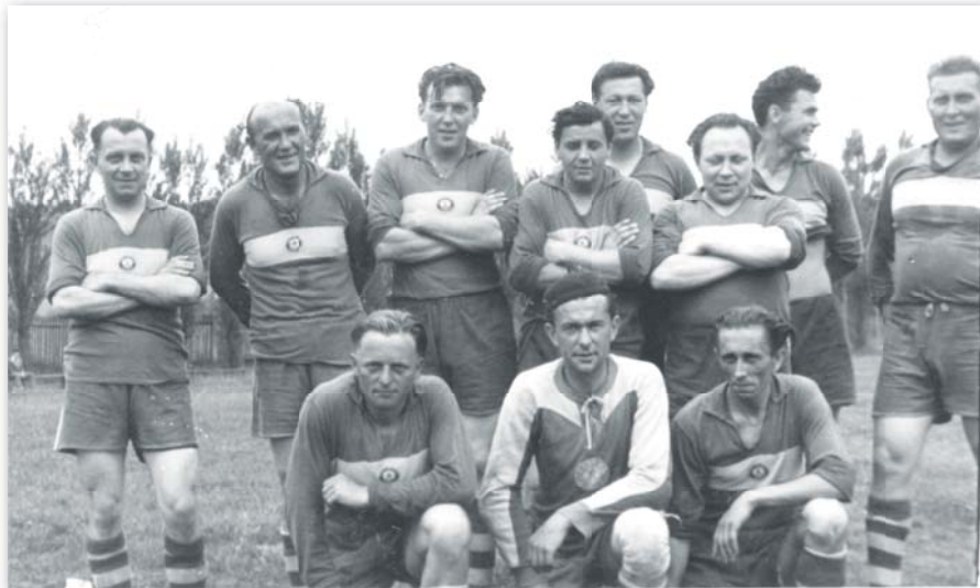
Hráči Tatrana Rožďalovice v roce 1957