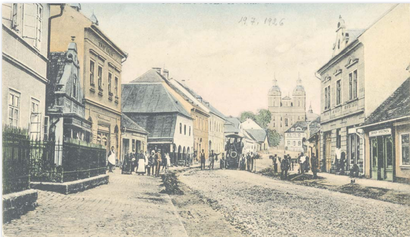
Úprava povrchu Kostelní ulice

Sotva že byla stavba silničních drah od rožďalovických hranic ke Kopidlnu a ke Křínci pojištěná, pomýšlelo se, aby Rožďalovice také s okresním městem Libání silniční dráhou spojeny byly. V roce 1856 byl celý silniční tah vyměřen, načež ihned stavěti se započalo. Od Psiníc skrze Křešice až ke Kroužku převzali občané psiničtí a křešičtí sami a