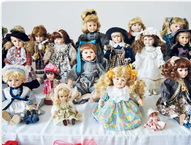
Ve Spolkovém domě bylo možno zhlédnout výstavu hraček...