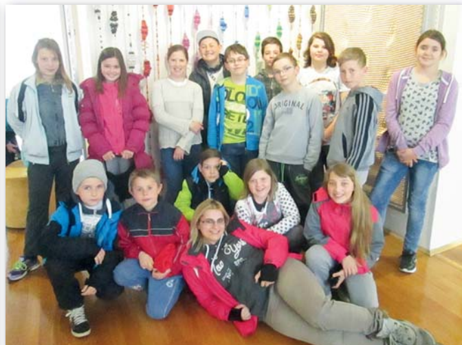
5. třída, 25.–29. dubna, Bedřichov v Jizerských horách