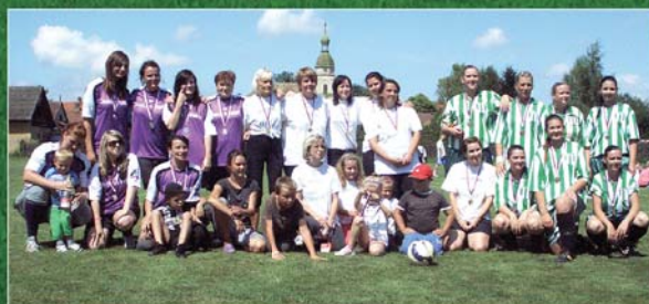
Zleva: Pojedský Blechy, Slůňata Žitovlice, Roždalky účastníci turnaje ženstých družstev 3. ročníku turnaje (2014)