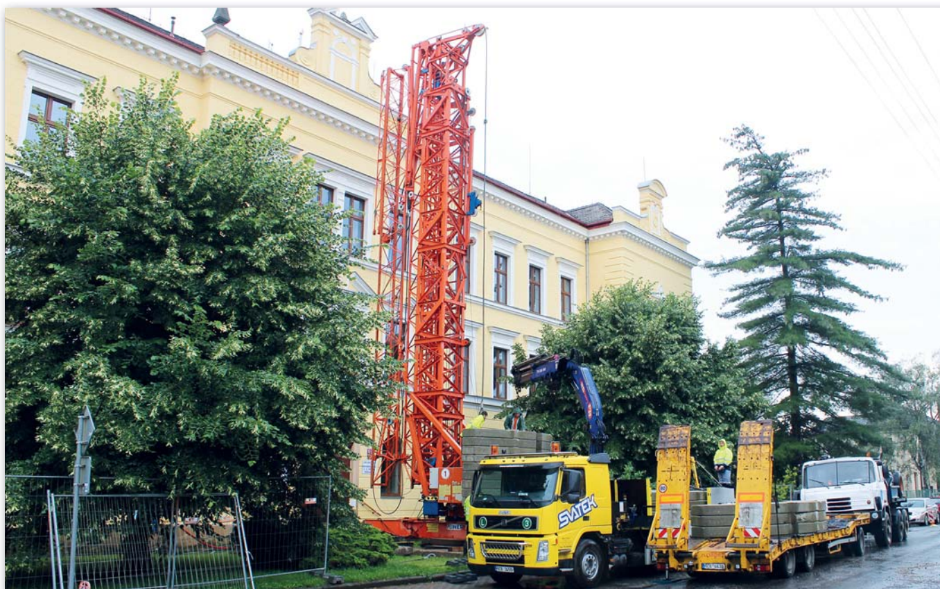
Koncem měsíce června byla zahájena rekonstrukce střechy základní školy