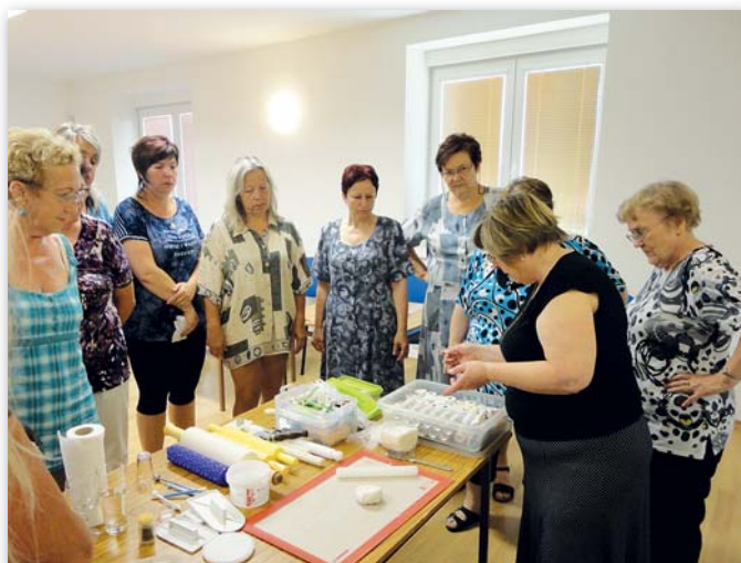
... nebo se zúčastnit cukrářského kurzu zdobení dortů