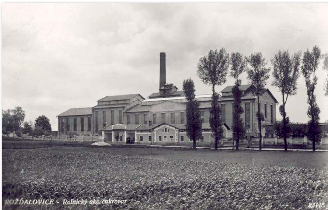
Cukrovar v roce 1930