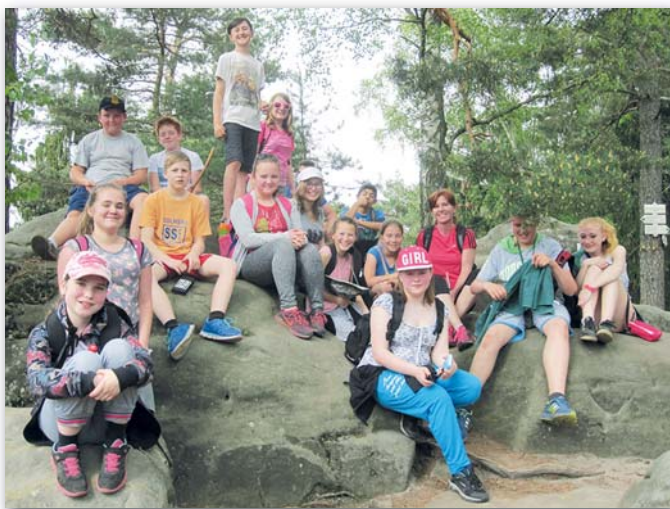
6. třída, 23.–27. května, Jinočice – Prachovské skály