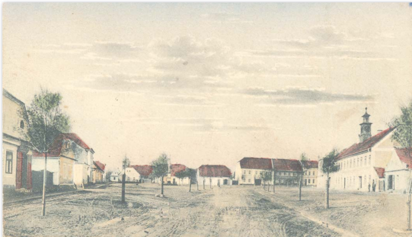
Náměstí na počátku dvacátých let 20. století