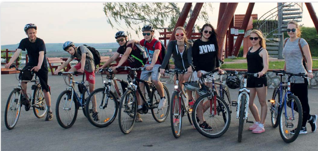
9. třída, 23.–27. května, Velké Pavlovice