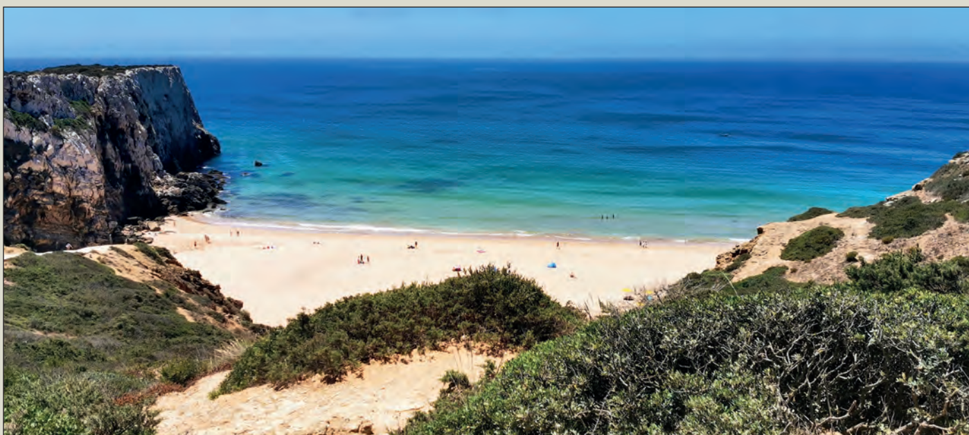
Alcalar – megalitické hrobky, kromlech Almendres, pobřeží jižního Portugalska