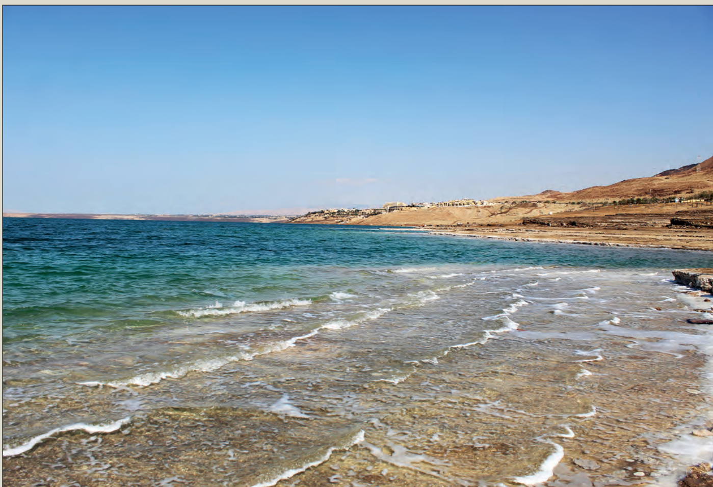
Mrtvé moře je teď, začátkem února, nejen mrtvé, ale taky pěkně studené