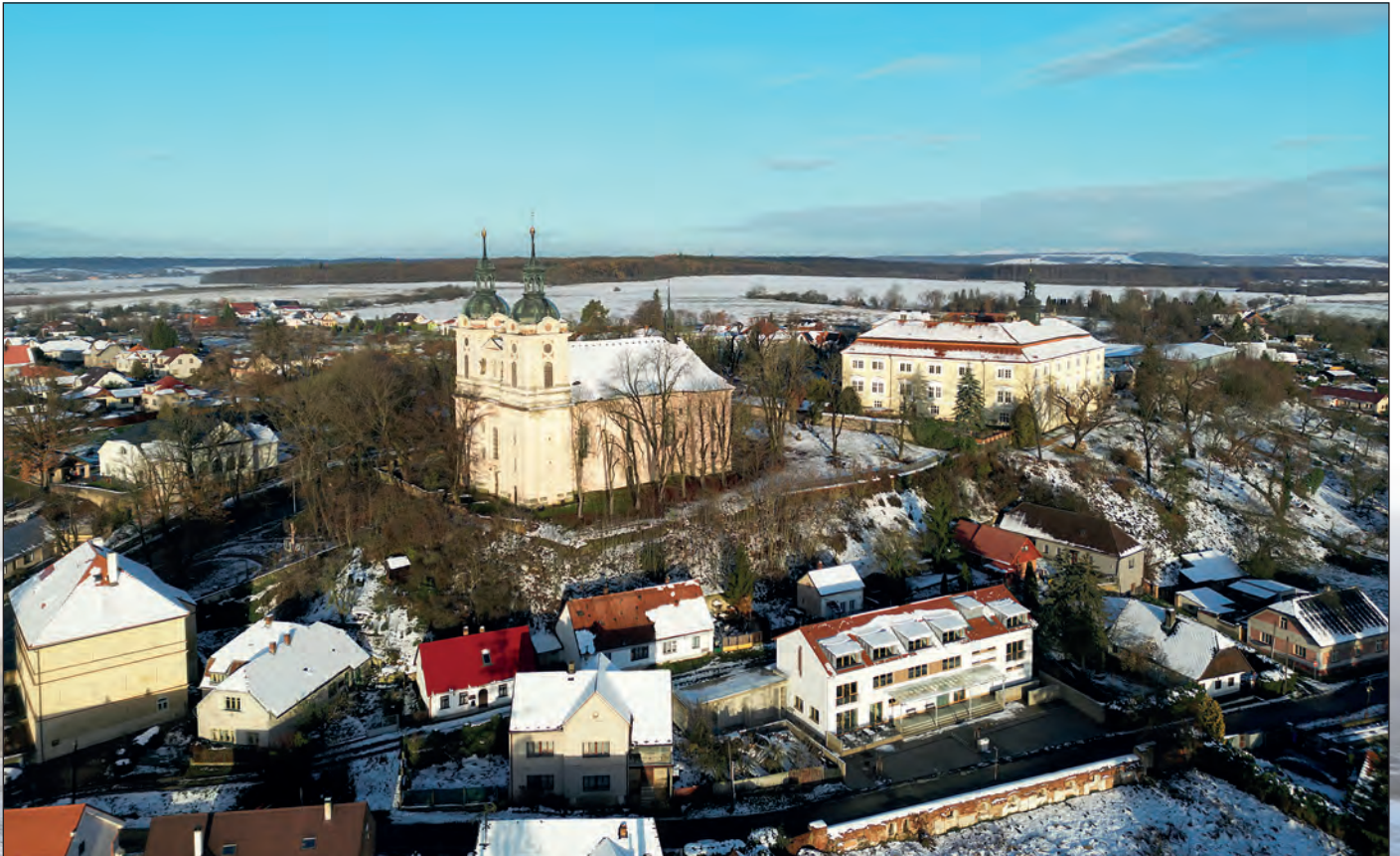
11. prosince 2023