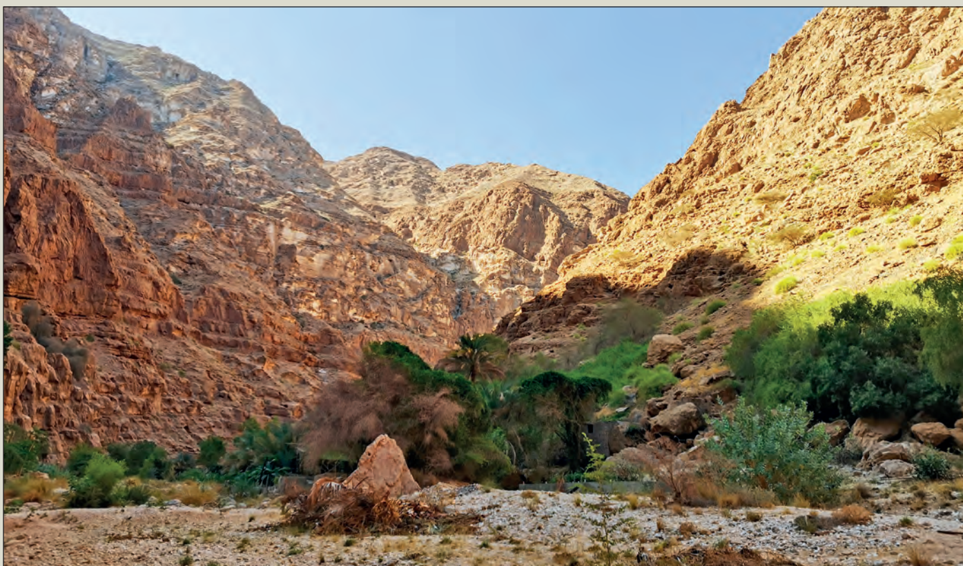
Z údolí je nejznámější a taky nejnavštěvovanější Wadi Shab. Za riál, tedy za šedesátikorunu, jsme pramicí dopraveni na protější břeh, po kterém vede zprvu široká, ale stále se zužující cesta. Jsem tady již podruhé (s horečkou poprvé), a tak si zdejší přírodu, sevřenou vysokými skalami, v klidu vychutnávám a fotím. Foto: bulbul arabský, pod ním čejka černoprská, vpravo mladý kvakoš noční. Dole celkový pohled na vstup do údolí.