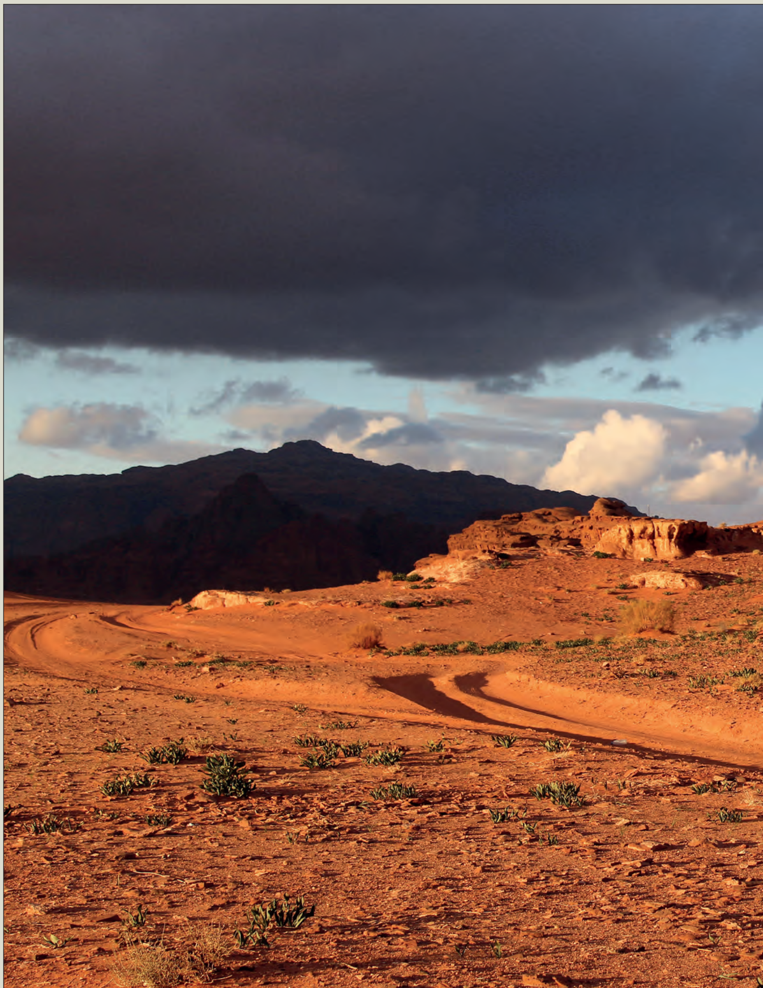
Západ slunce ve Wadi Rum