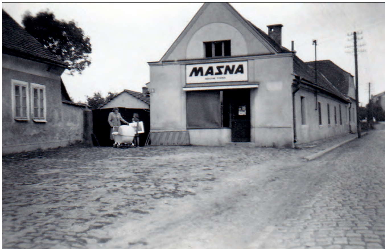
Dům čp. 79 na náměstí, počátek 50. let 20. století