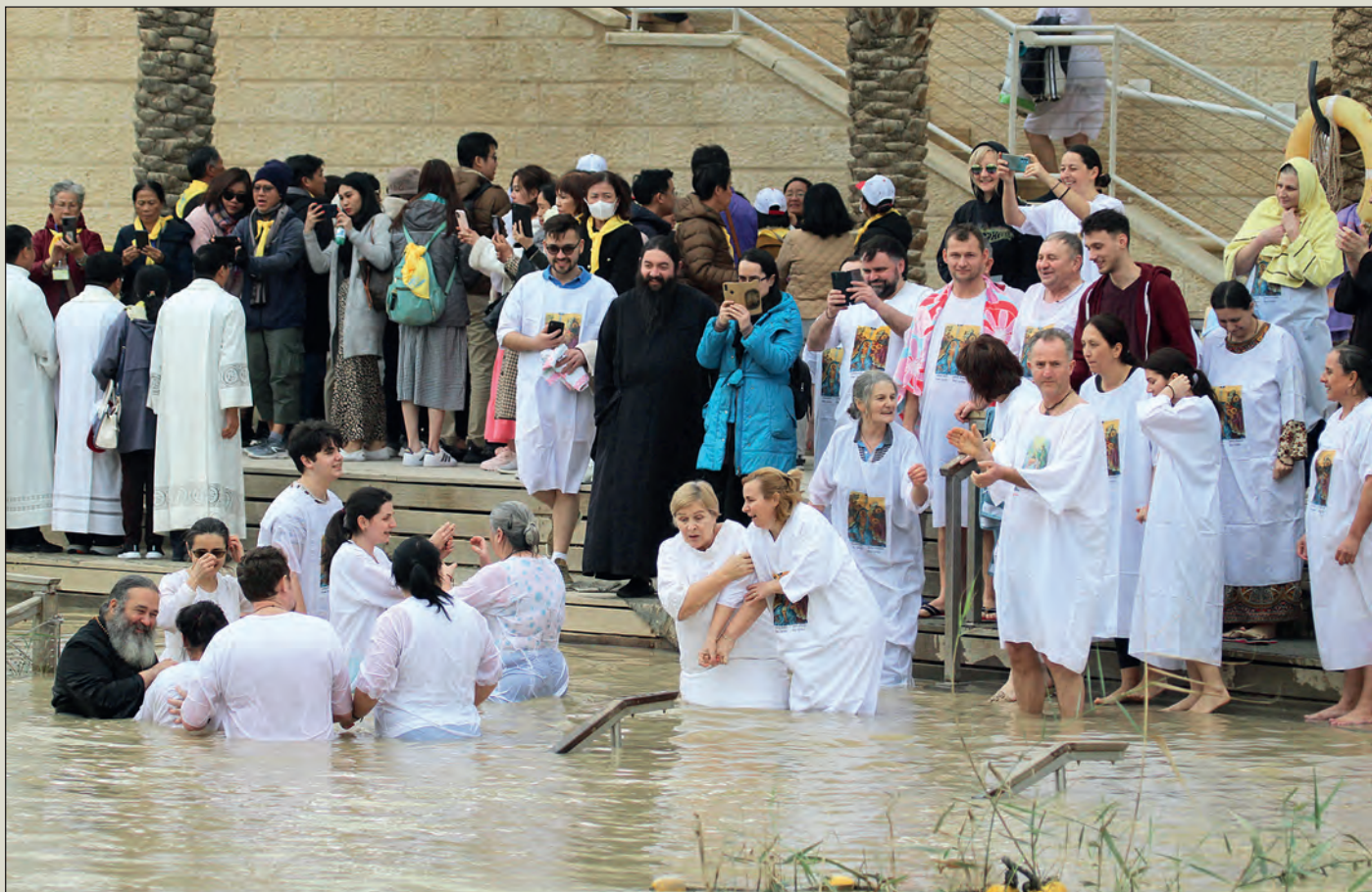
V Betánii Zajordánské pozorujeme mumraj na protějším, západním břehu Jordánu. Tak jako snad každý den tady probíhá křest