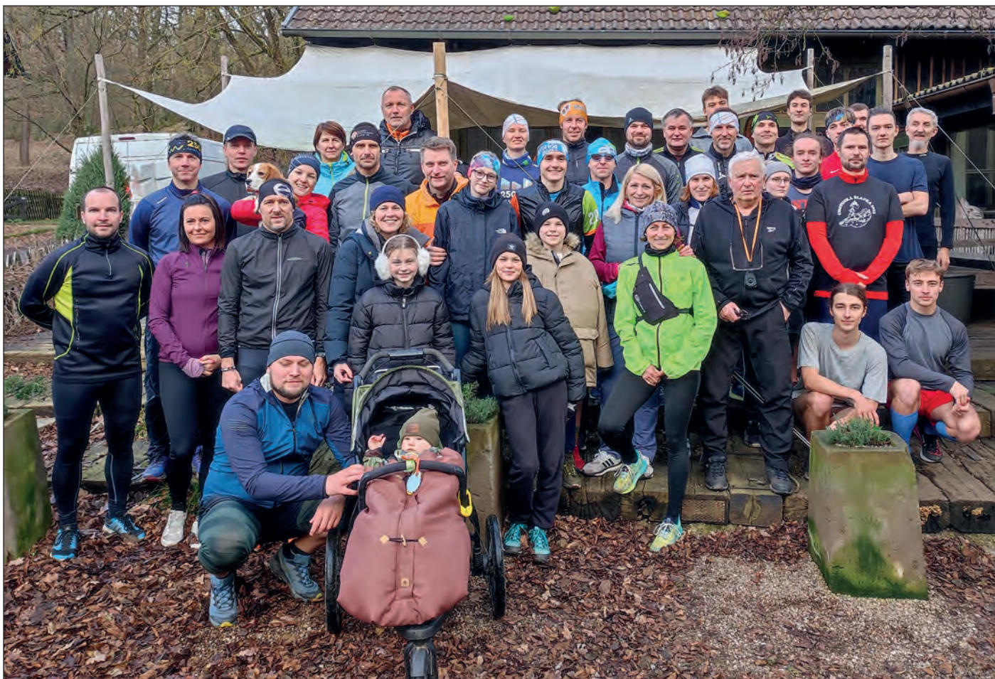
Šestatřicet běžců a běžkyň absolvovalo v sobotu 30. prosince osmikilometrový silvestrovský běh