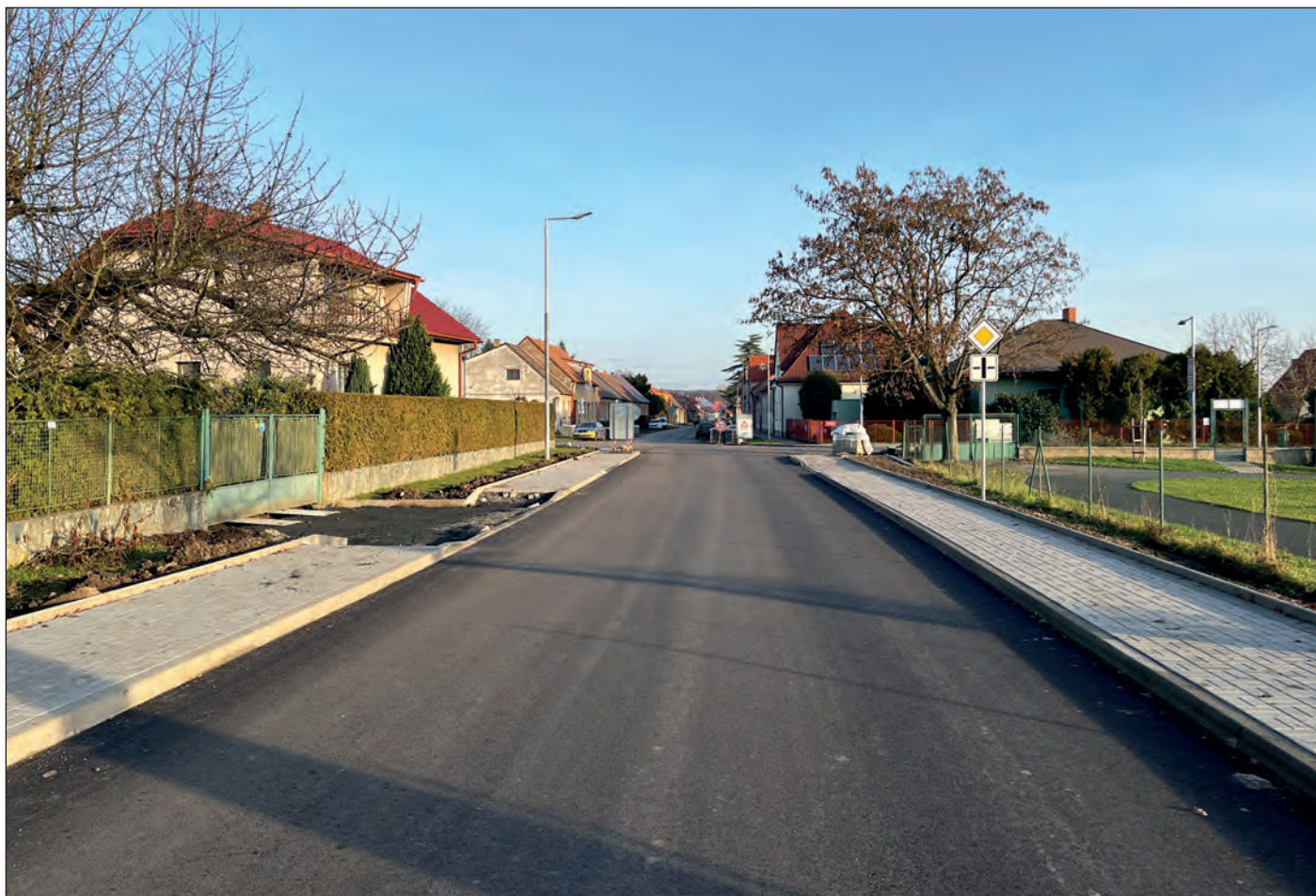
V prosinci se pak v této ulici pokračovalo s pokládáním chodníků