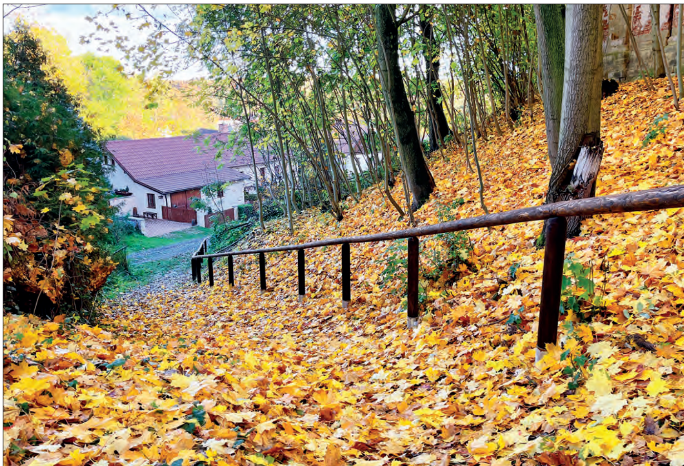
Počátkem listopadu bylo v Barboře osazeno dřevěné zábradlí