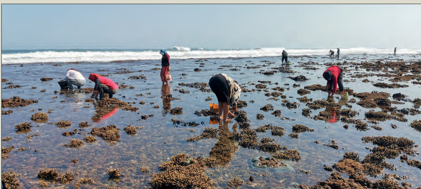
Krajina v okolí sopky Ijen, rýžoviště na východní Jávě, sběr mořských živočichů při odlivu ve Watu Karungu