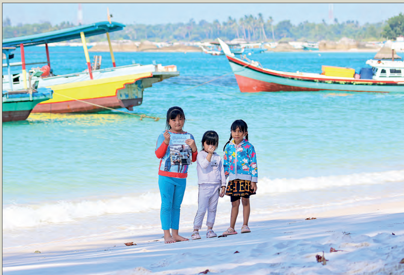
Děti na pláži v Keciputu na Belitungu jsem zaujal velkým teleobjektivem a chtěly vyfotit. Rožďalovicko prý „nais“