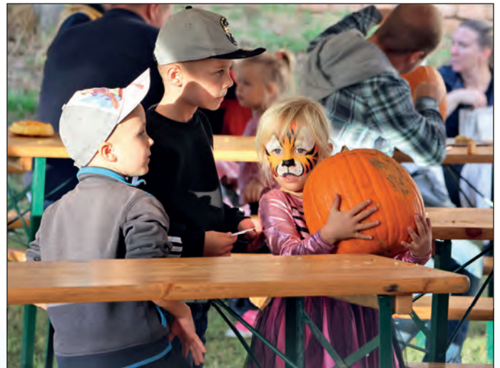
Galerie Melantrich patřila o posvícenském víkendu halloweenským dýním. V sobotu 21. října odpoledne hostila již podruhé akci nazvanou Rožďalovická dýně. Malí i velcí si zde mohli vydlabat svou dýni podle vlastní fantazie