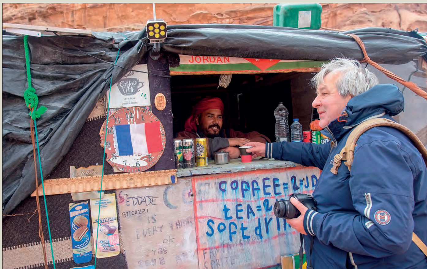
Cestou na Malou Petru