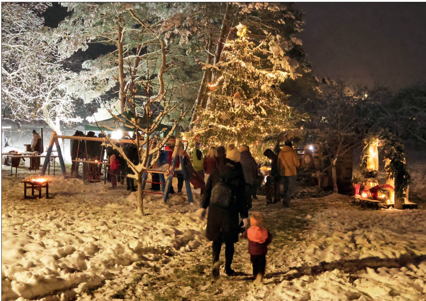
Vánoční stromek v sobotu 2. prosince rozsvěceli také ve Viničné Lhotě