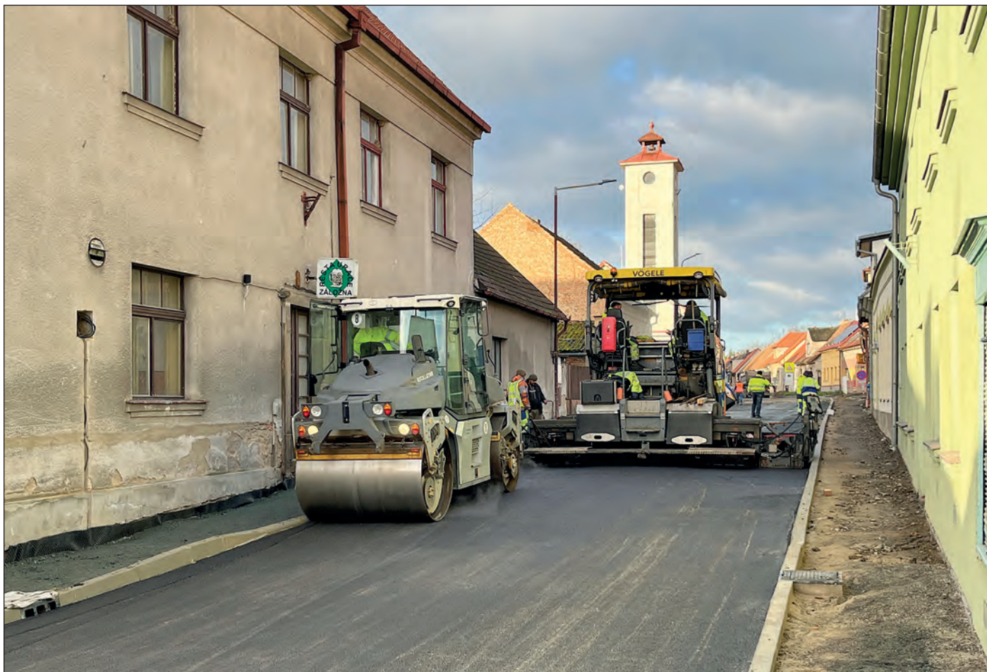
Koncem listopadu byl položen nový asfaltový povrch v částech Tyršovy ulice, které procházejí celkovou rekonstrukcí