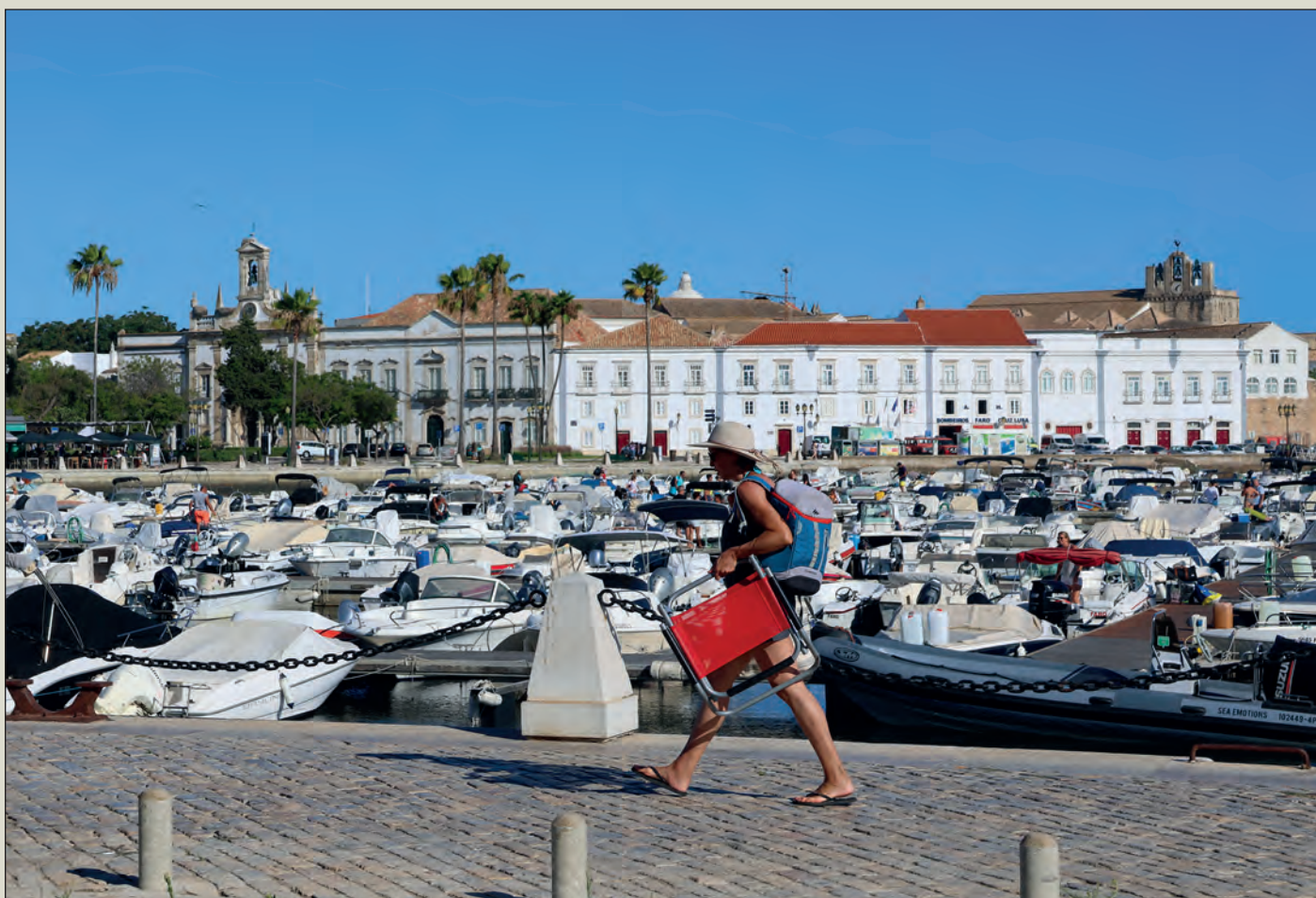
Portugalsko je známé pěstováním korkových dubů. Faro, hlavní město provincie Algarve