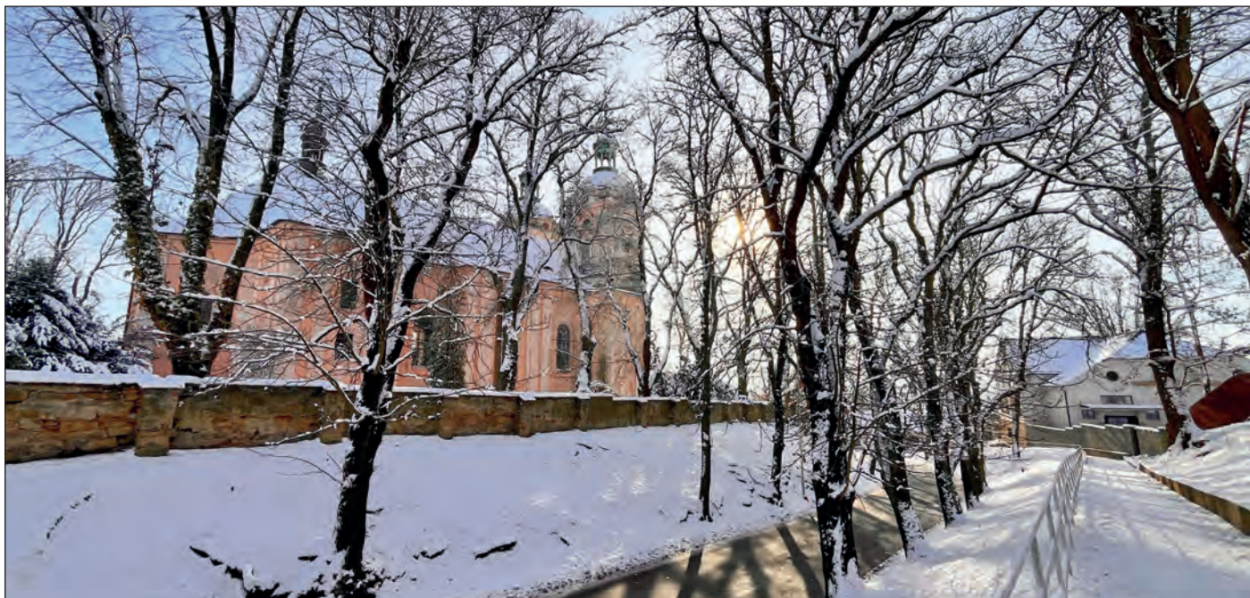
S počátkem prosince napadl první sníh

klesla teplota pod -10\text{ }^{\circ}\text{C} . Obleva se začala hlásit o slovo pozvolna koncem pracovního týdne, o víkend uží ani noční teploty neklesaly pod nulu, a tak značné množství sněhu vcelku rychle odtávalo, takže již v úterý 12. prosince, kdy bylo převážně polojasno a teplota vystoupala v odpoledních hodinách až na 10\text{ }^{\circ}\text{C} , po něm nebylo ani památky. S výrazným oteplením se tak srážky proměnily v dešťové. Nadprůměrné teploty vydržely až do konce týdne, třetí adventní neděle byla slunečná ( 8\text{ }^{\circ}\text{C} ). Následující týden bylo počasí značně pro-