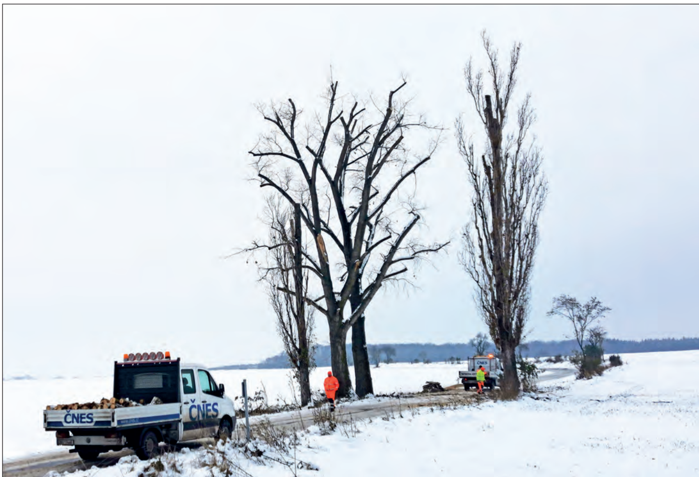
Silničáři prořezali začátkem prosince topoly U Isidora