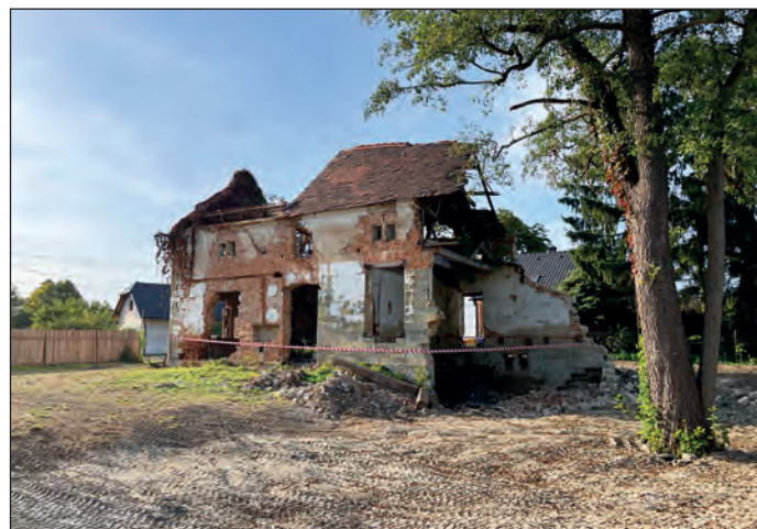
Likvidace obou černých skládek na Nové Hasině stála město téměř 1,2 milionu korun