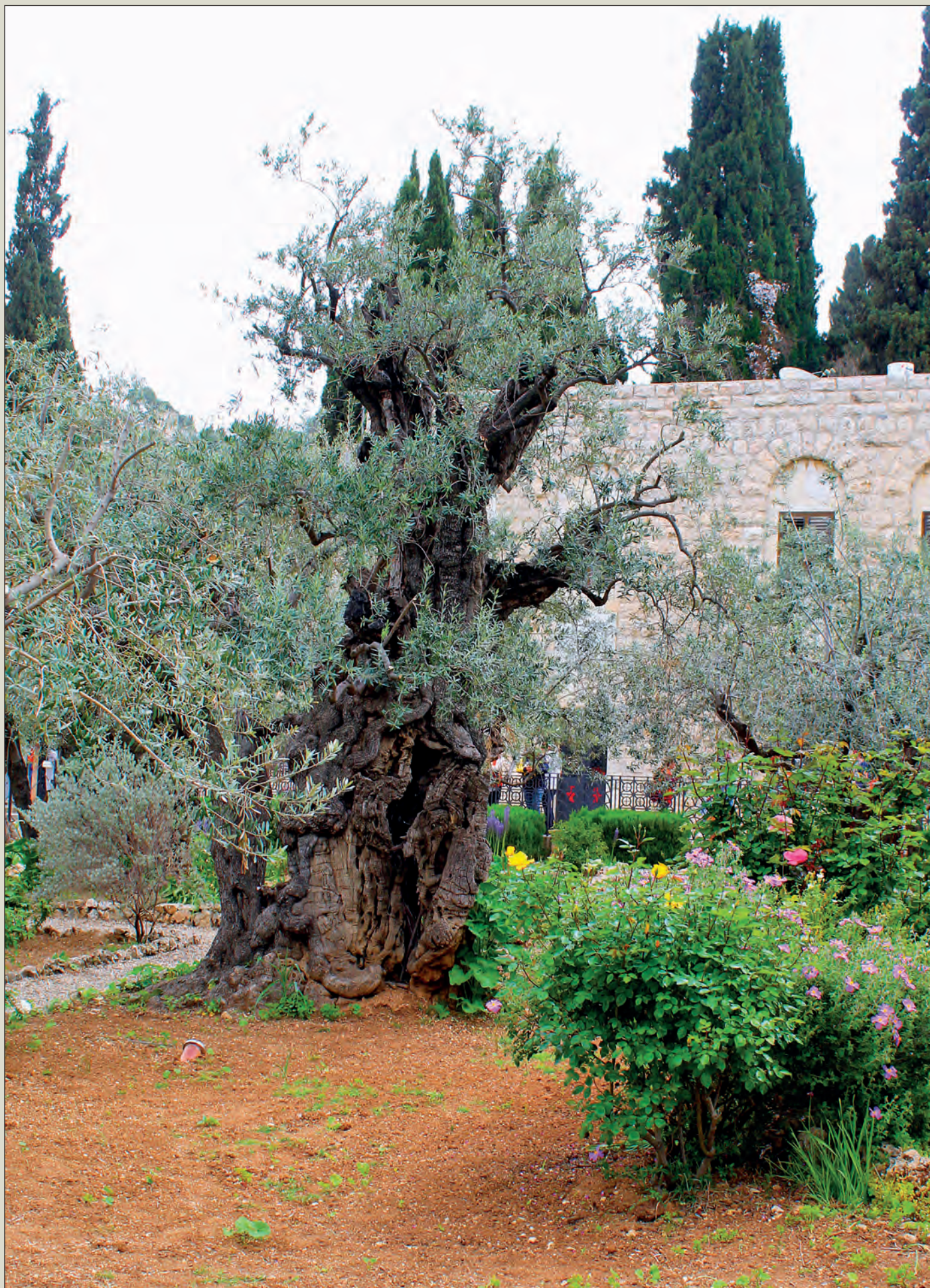
Starý olivovník v zahradě Getsemanské na Olivové hoře v Jeruzalémě