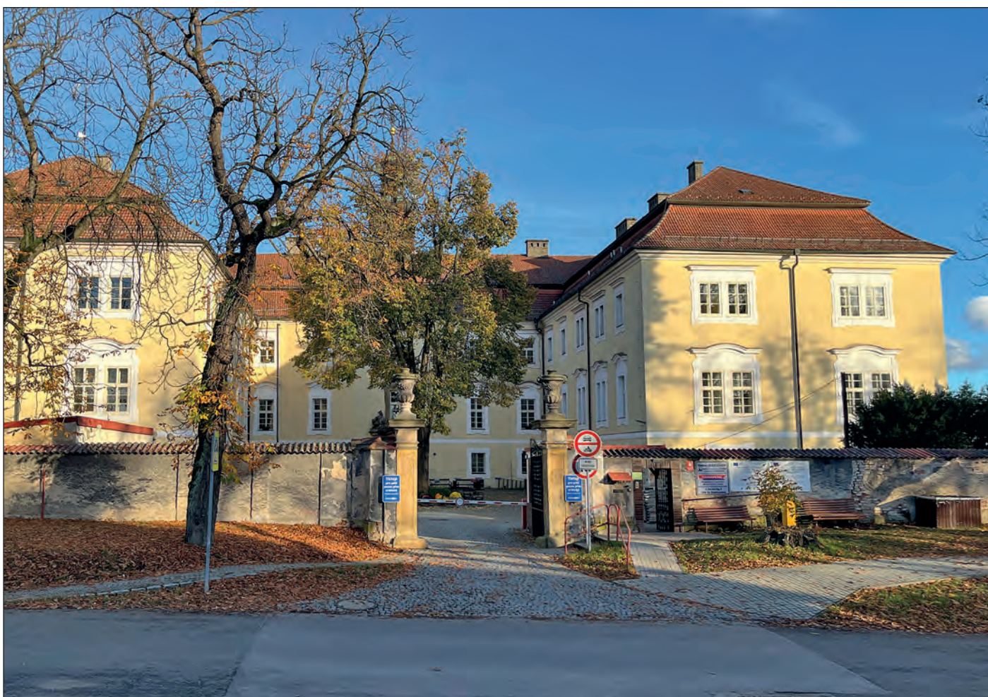
Během listopadu dokončil Domov Rožďalovice realizaci projektu snížení energetické náročnosti budovy kláštera a zámku