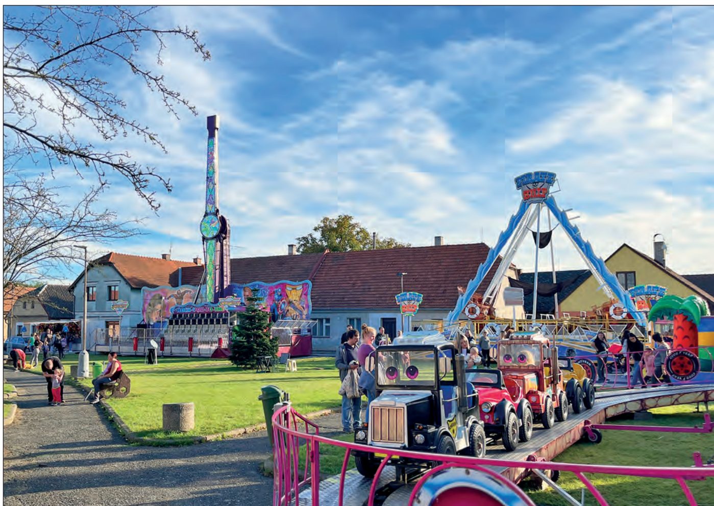
Letošnímu posvícení přálo hezké počasí