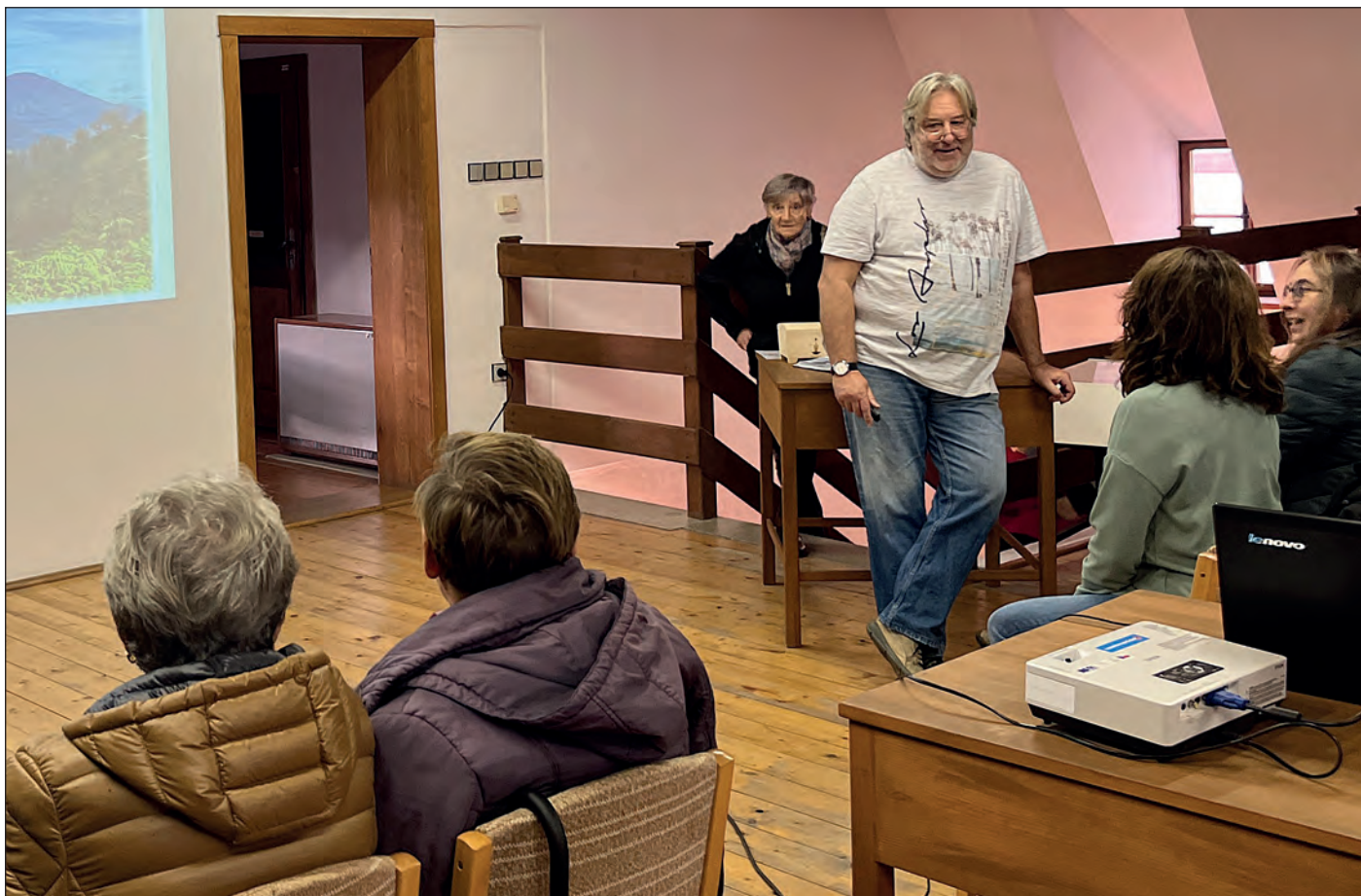
Na podzim se v Galerii Melantrich uskutečnily dvě přednášky Jiřího Rejska o jeho cestách na indonéské ostrovy Jávu a Belitung