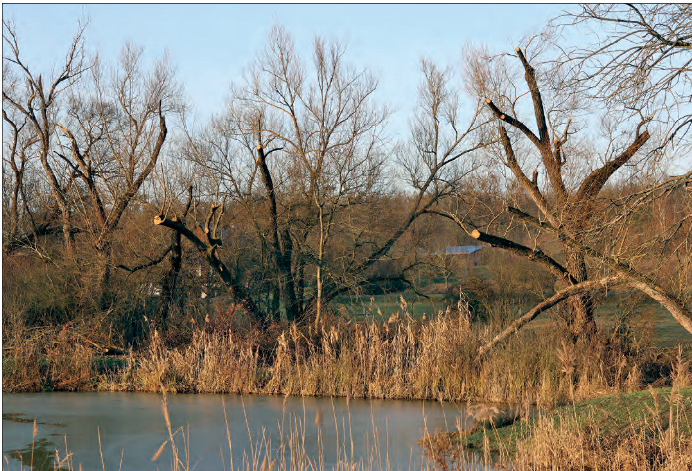
V prosinci proběhla údržba stromů na naučné stezce Holské rybníky