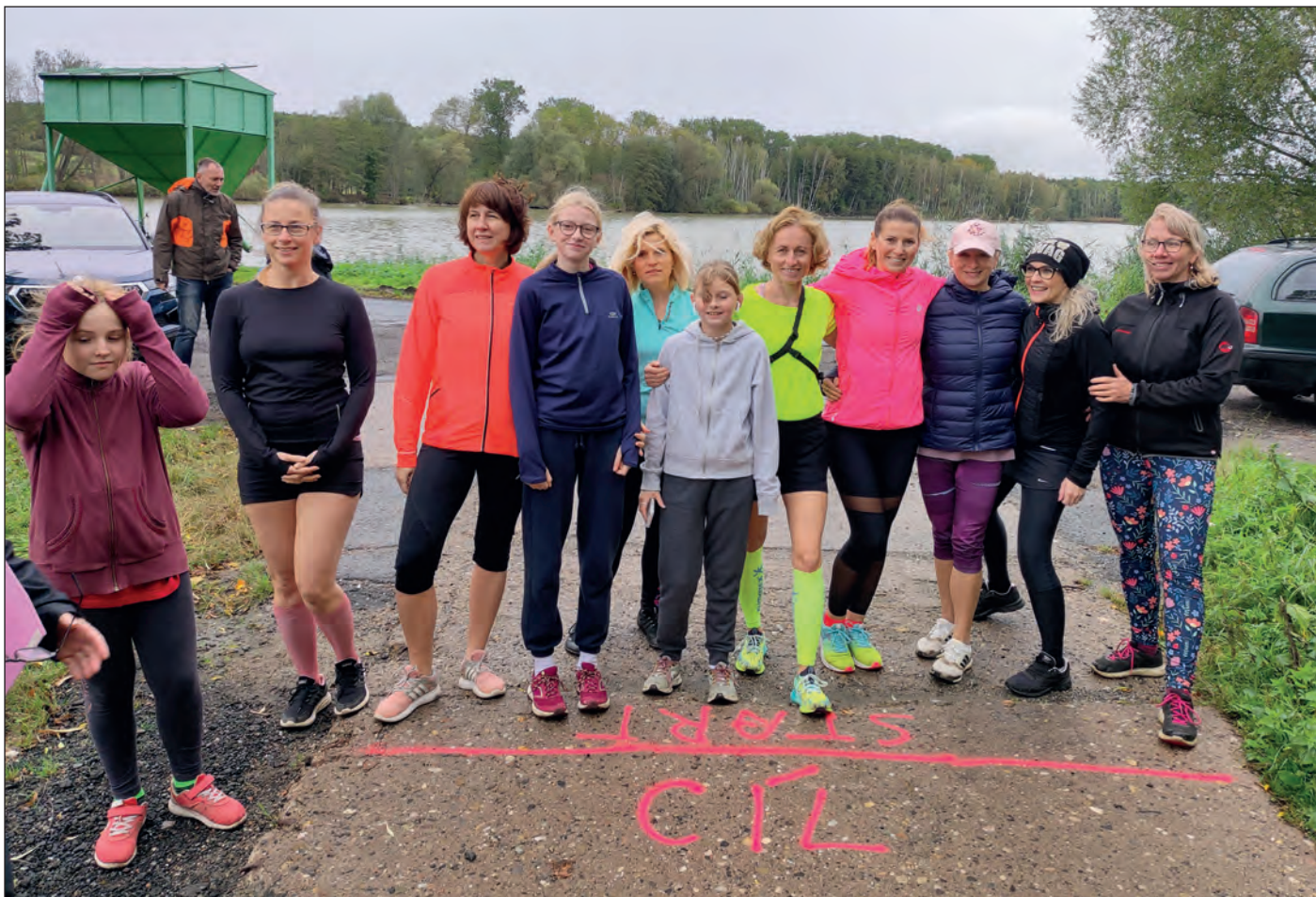
V úterý 17. října se konal již potřinácté hasinský dívčí a ženský běh dlouhý 4 km