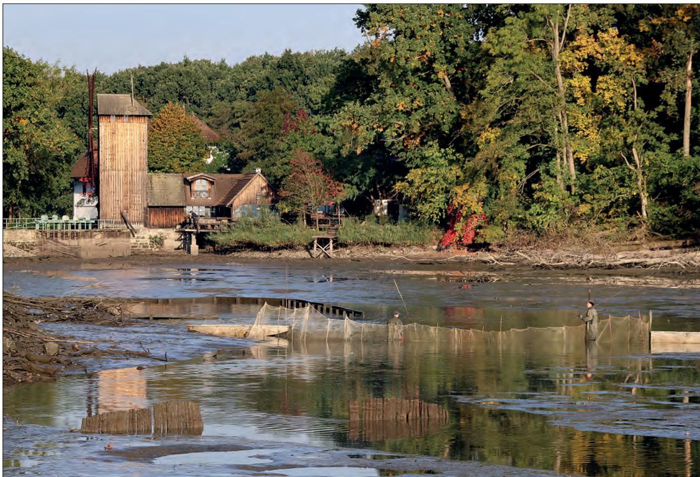
Od října probíhaly výlovy našich rybníků, např. Bučický rybník byl sloven ve středu 18. října