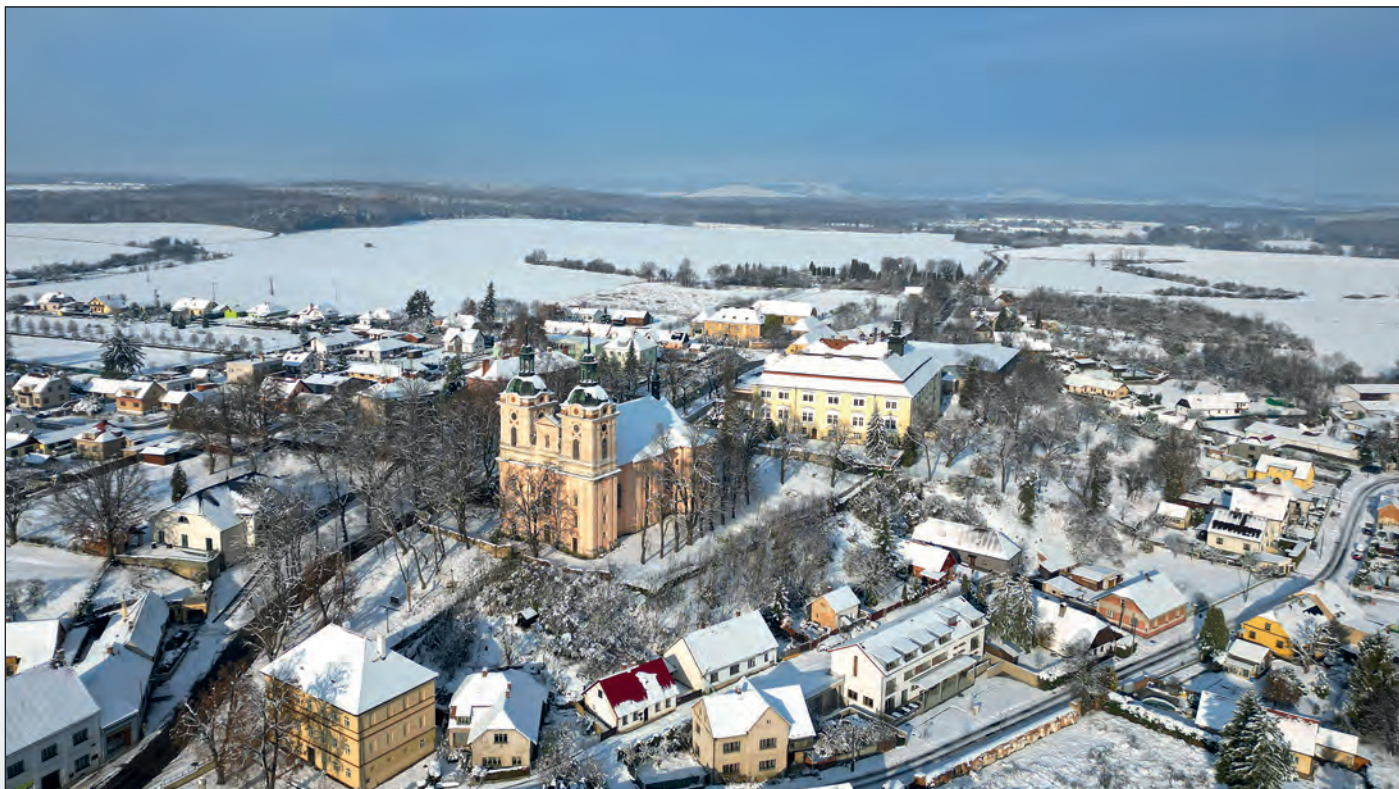
4. prosince 2023