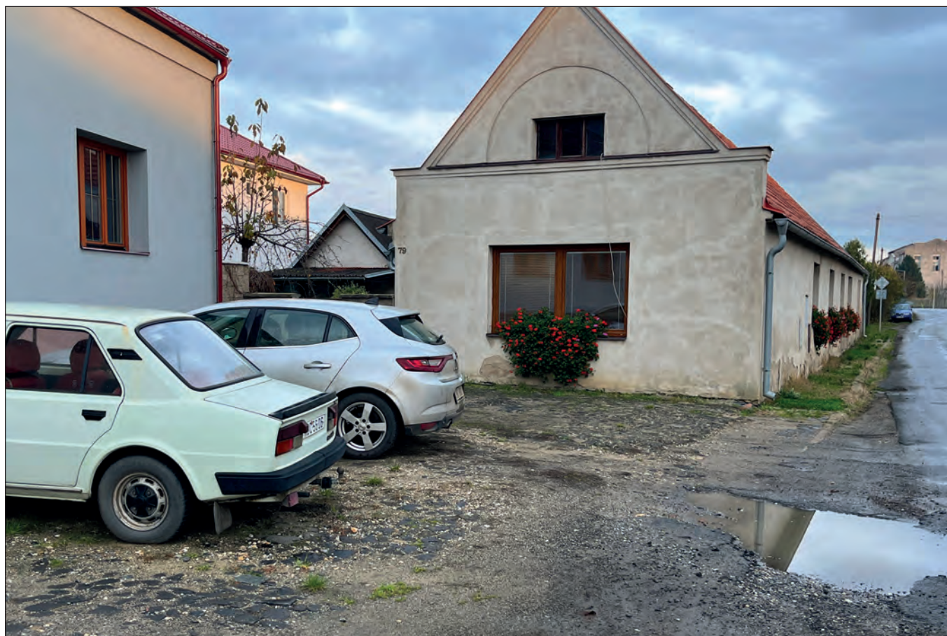
Stejně místo dnes (18. listopadu 2023)