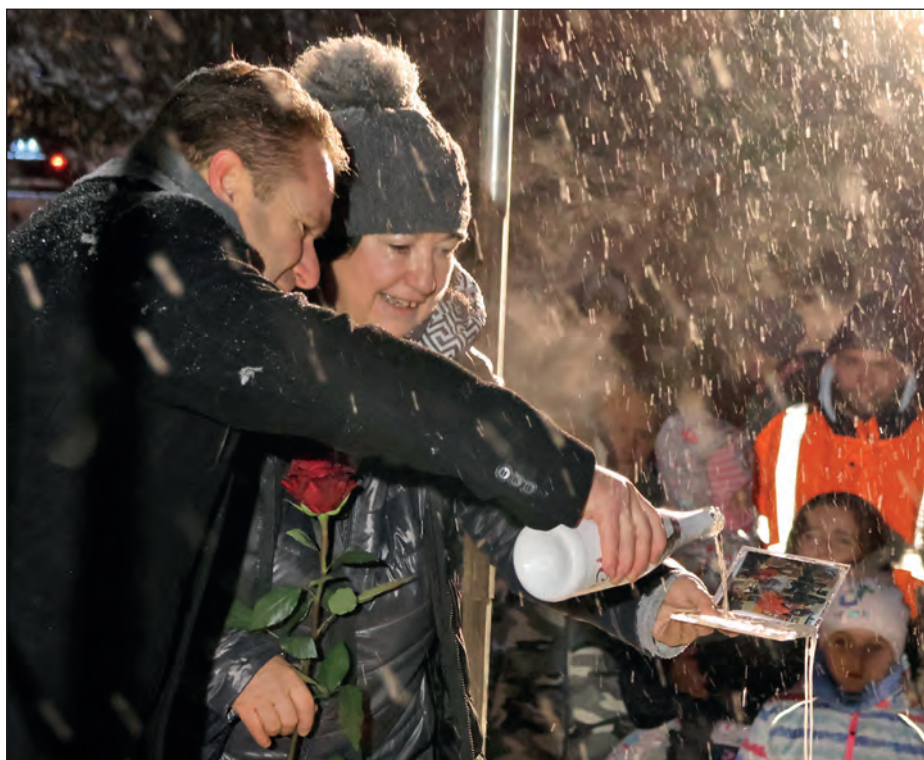
Slavnostní křest CD proběhl při rozsvěcení vánočního stromku