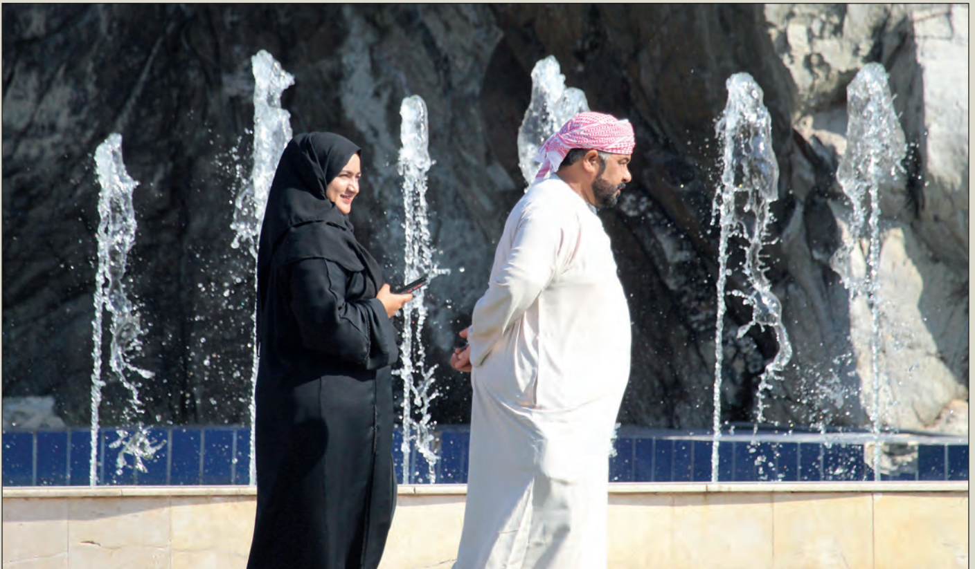
Moderní arabská země, ve které se dodržují tradice