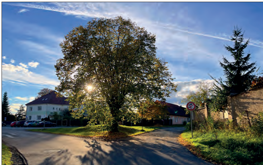
Počátek listopadu byl teplotně nadprůměrný

Oteplovat se pozvolna začalo hned od úterý, nejteplejším dnem celého týdne se stala středa 11. října, kdy převládala polojasná obloha a teplota vystoupala ve 14.00 na letních 25,1 °C, v 16.00 dokonce ještě na 28 °C. Téměř 24 °C ukázal teploměr ještě v pátek 13. října, teplá byla i noc na sobotu, kdy po ránu nebyla ani rosa, a sobotní odpoledne s 22 °C. Odpoledne s přechodem studené fronty přišlo výrazné ochlazení, teploty se propadly téměř o 10 stupňů, v noci klesaly ke 2 °C, v dalších dnech nebyly výjimkou ani ranní přízemní mrazíky – topná sezona začala.