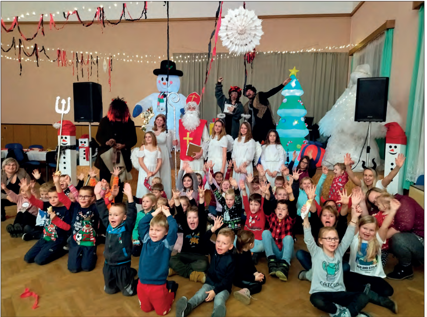
V pondělí 4. prosince obdaroval Mikuláš desítky dětí, které se svými rodiči zavítaly do sálu radnice na akci nazvanou Kouzelné pekličko s Břepťíkem. O čtyři dny později přišel Mikuláš s čerty i na Starou Hasinu. Více než dvacet žen se zúčastnilo v pátek 1. prosince Vánočního tvoření ve Spolkovém domě (foto dole)