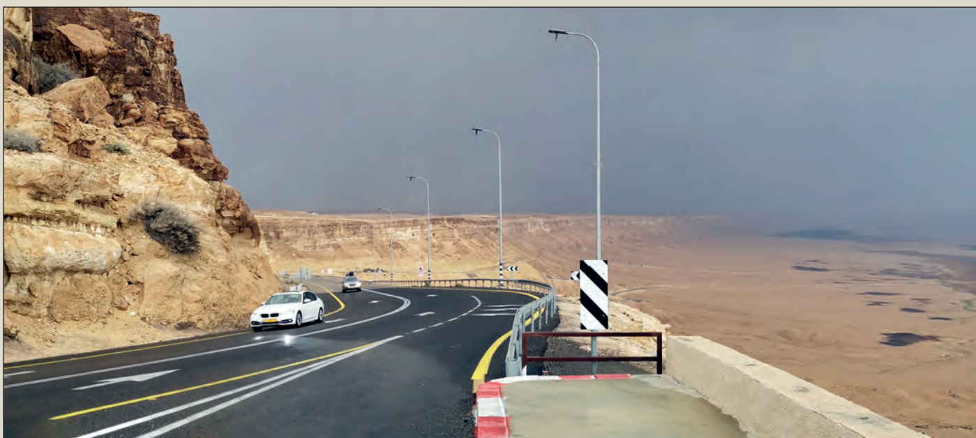
Skalní klášter sv. Jiří, pevnost Masada, bouře v Negevské poušti