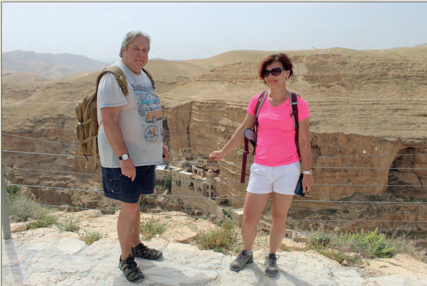
Skalní klášter sv. Jiří nedaleko Jericha jsem při první izraelské cestě nenašel. Teď už tam vodím spolucestující