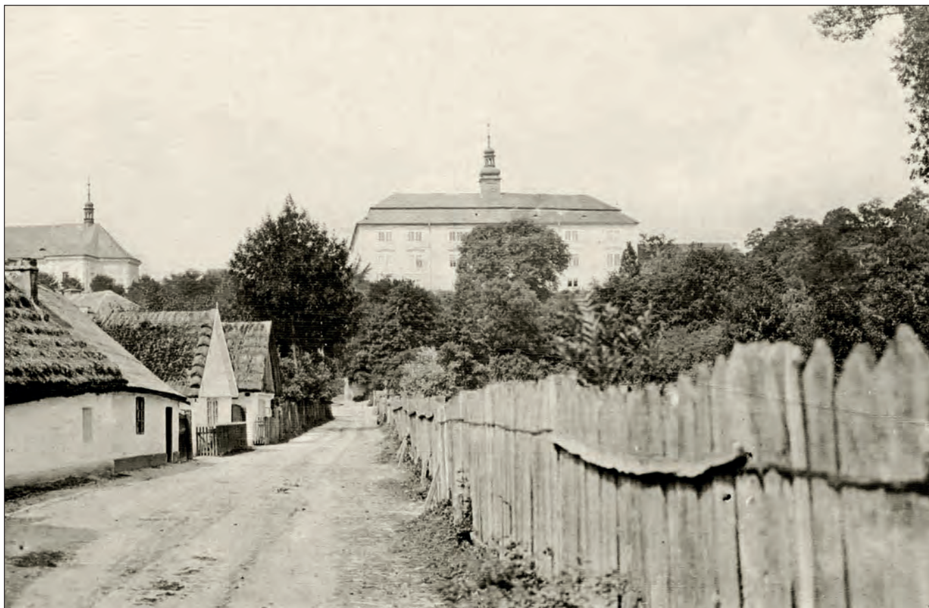
Obůrka koncem 19. století