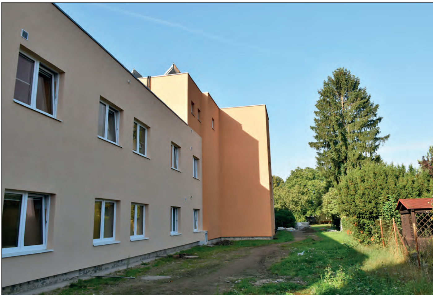
V září začal Domov Rožďalovice zateplovat budovu kláštera