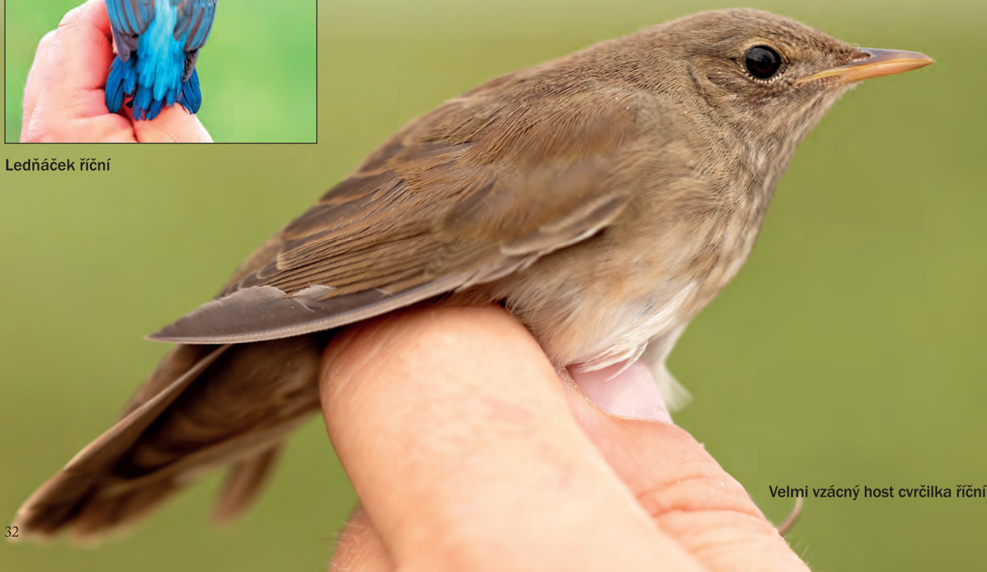
Velmi vzácný host cvrčilka říční