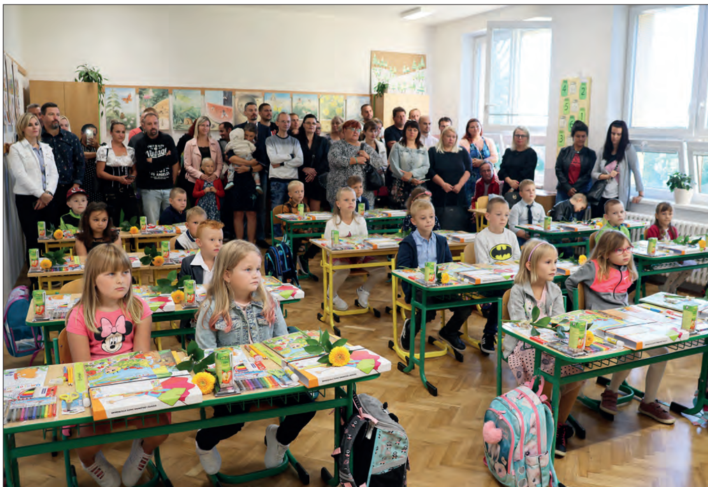
V první třídě jsme přivítali dvacet jedna nových žáčků