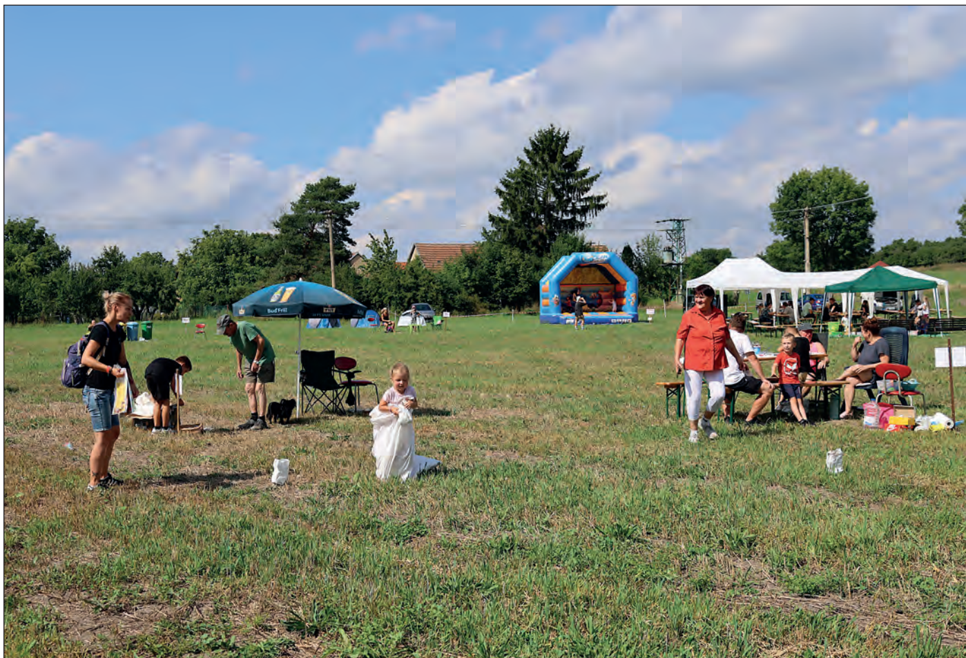
V sobotu 26. srpna proběhlo v Ledečkách rozloučení s prázdninami