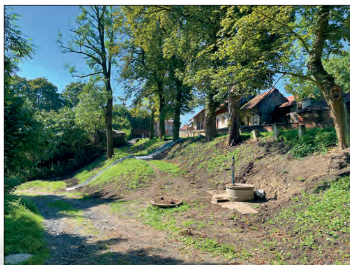
Začátkem letních prázdnin bylo vyčištěno prostranství kolem studánky v Barbořce, počátkem září zde pak byly vysázeny okrasné dřeviny a pokračovalo se v dalších terénních úpravách