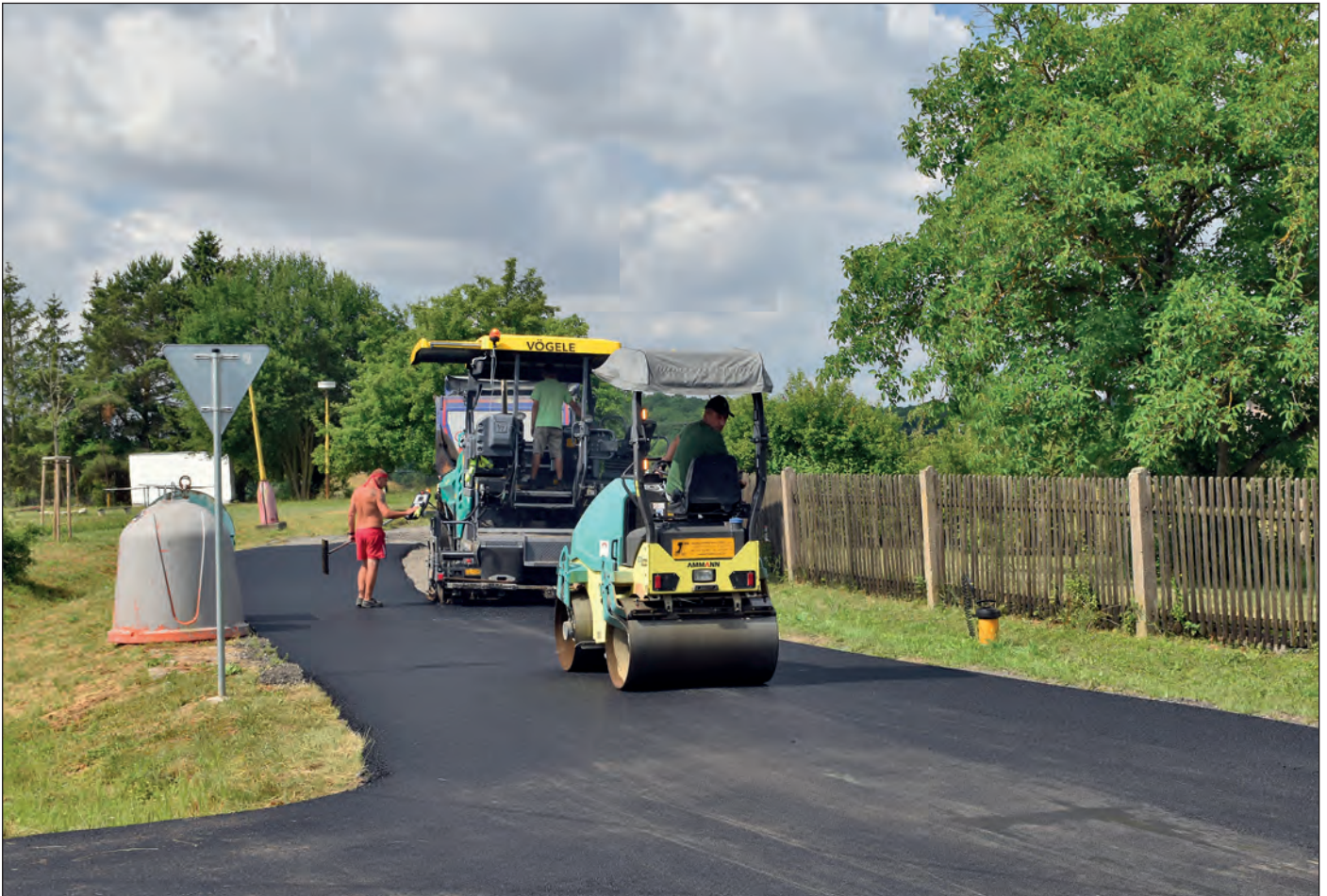
Na Nové Hasíně byla počátkem léta vyasfaltována část silnice