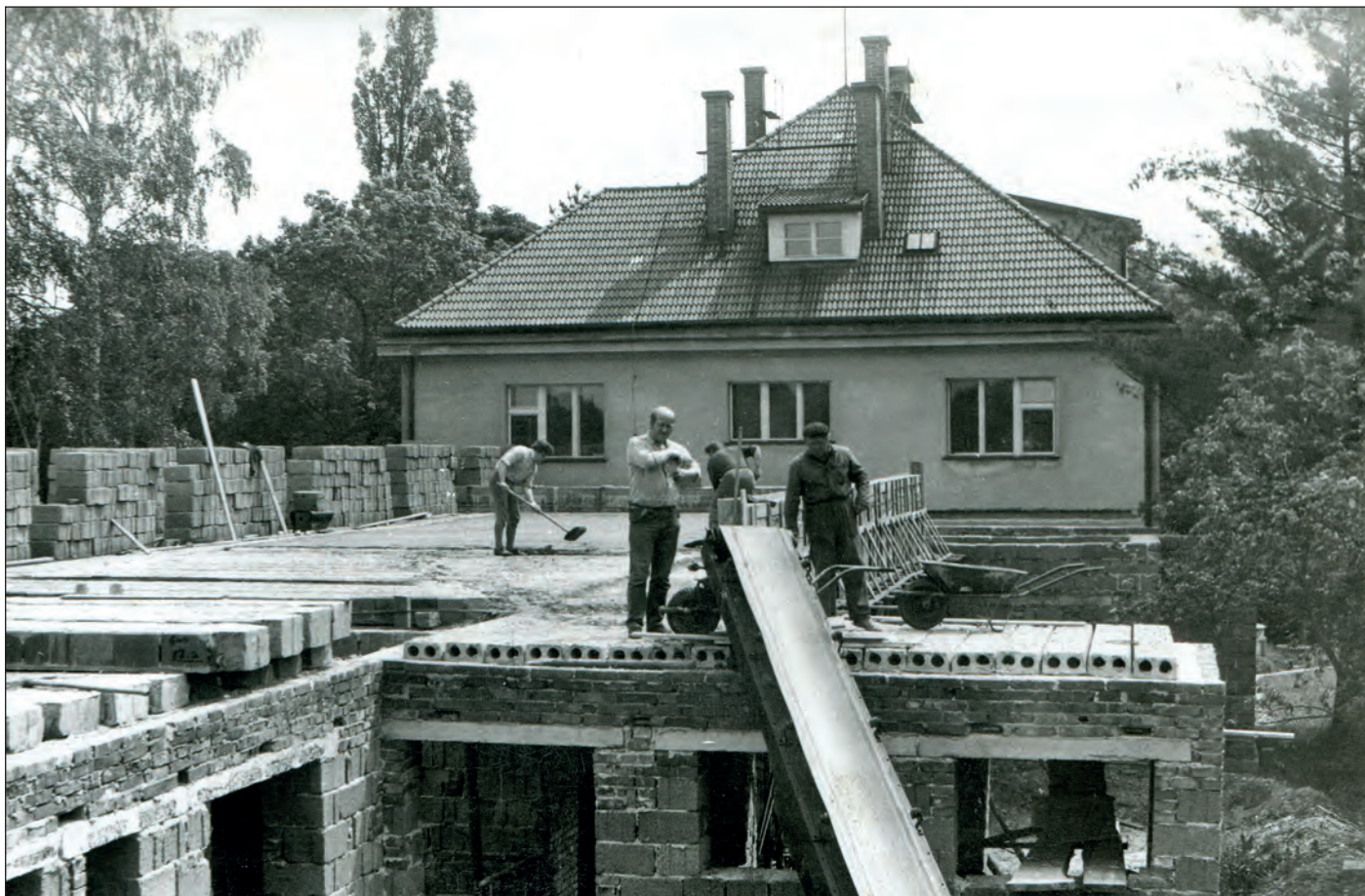
Na stavbě mateřské školy se pracovalo brigádně každý víkend