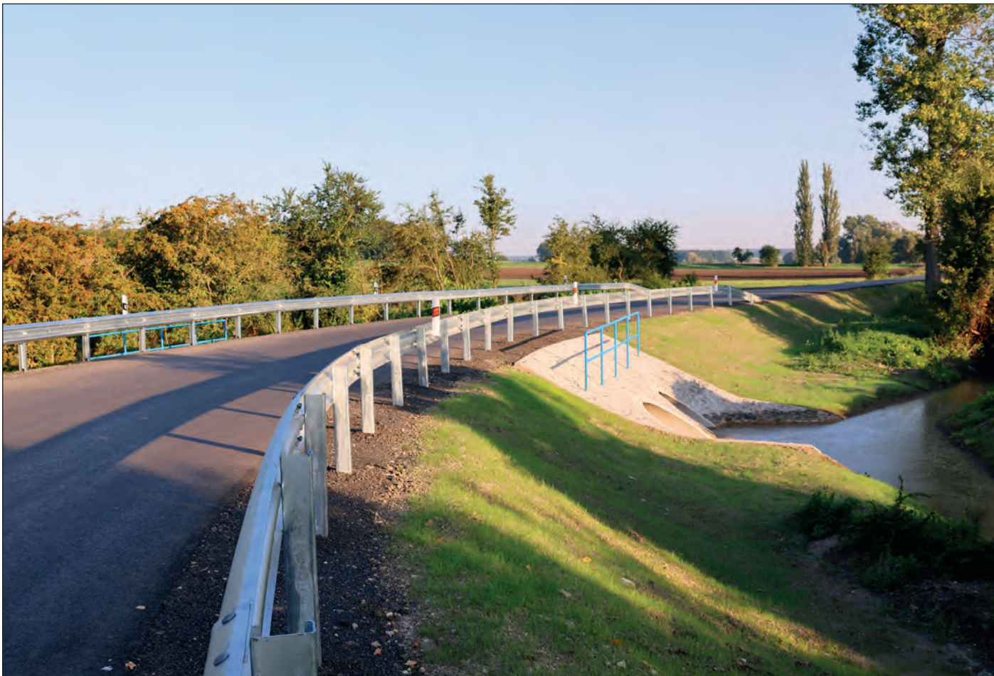
Od května do srpna probíhala oprava propustku a komunikace u Nových Zámků, investorem stavby byl Středočeský kraj