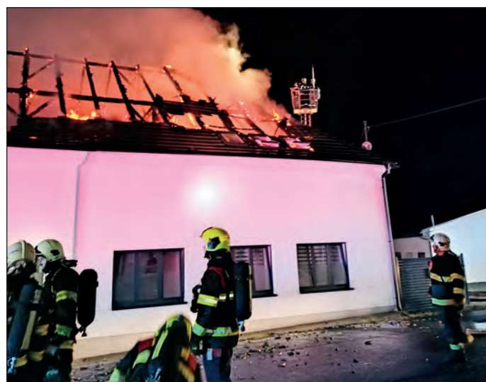
V neděli 24. září večer byla povolána jednotka rožďalovických hasičů jako posila k požáru objektu velkoskladu potravin v Činěvsi. Rozsáhlý požár likvidovaly celkem dvě profesionální jednotky z Nymburka a Poděbrad a osm hasičských dobrovolných sborů. Přímé škody na objektu byly předběžně vyčísleny na deset milionů korun