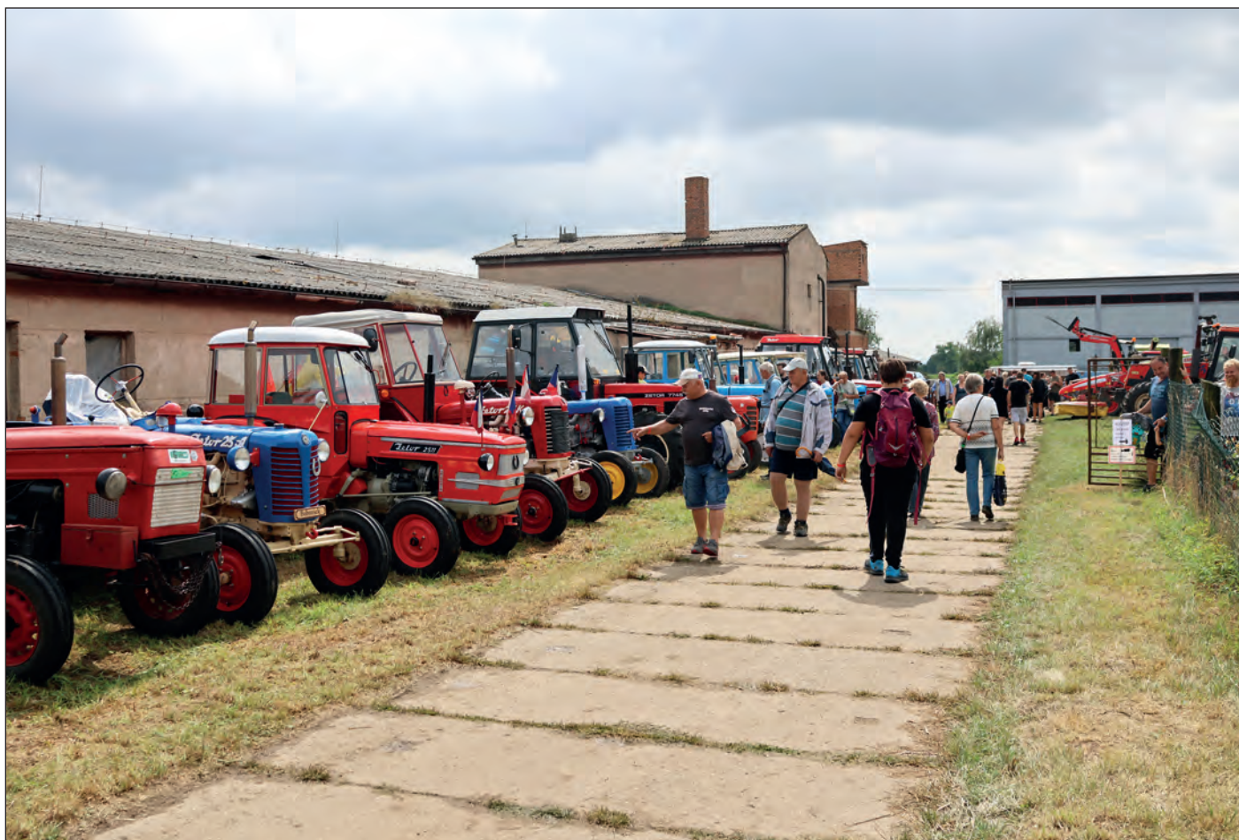
Týž den se uskutečnila v Košíku Traktoriáda