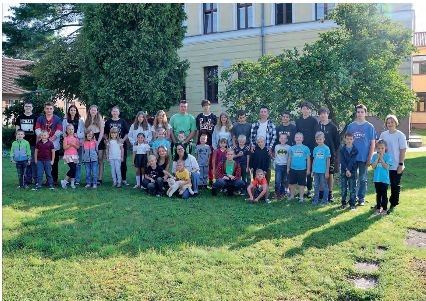
Devětáci se od prvního dne stali patrony prvňáčků