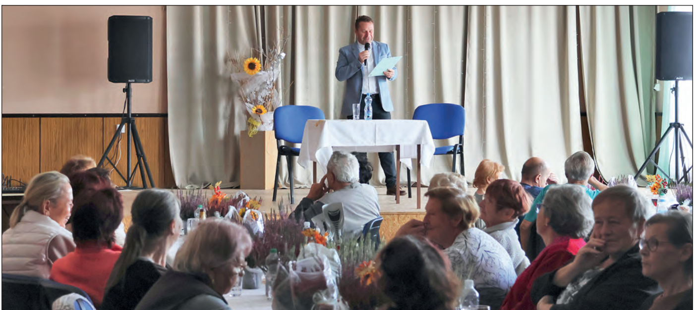
Setkání se spoluobčany, 5. října