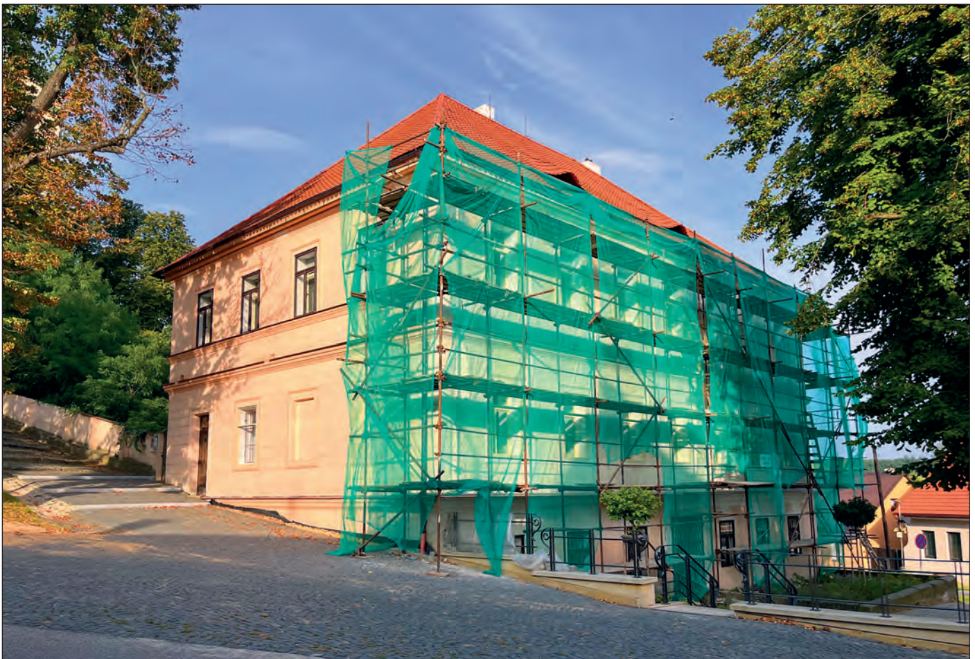
Koncem letních prázdnin byla zahájena úprava fasády na staré škole