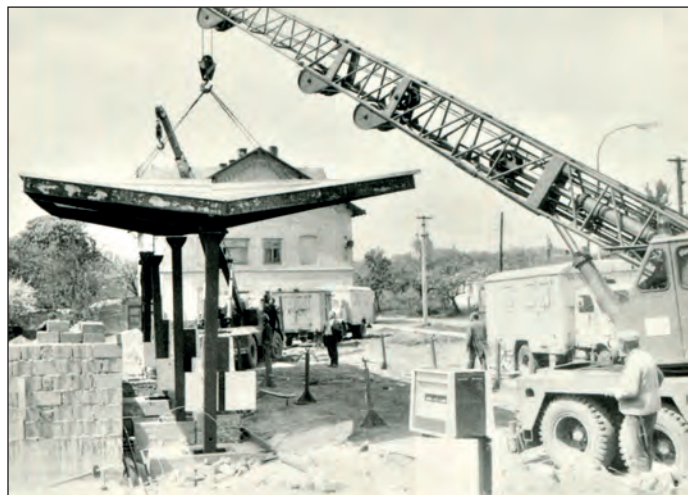
Stanice pohonných čerpacích hmot byla vybudována brigádně v tzv. akci Z (zvelebování měst a obcí)