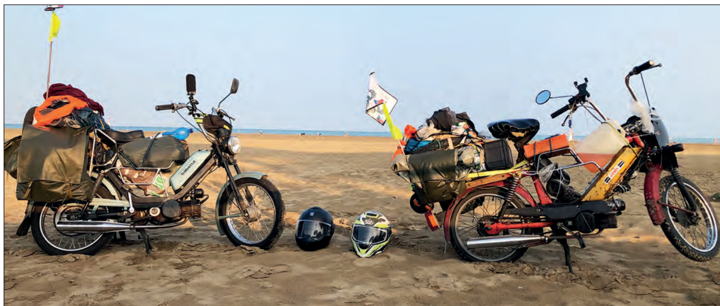
Konečně v cíli – na pláži v Caorle