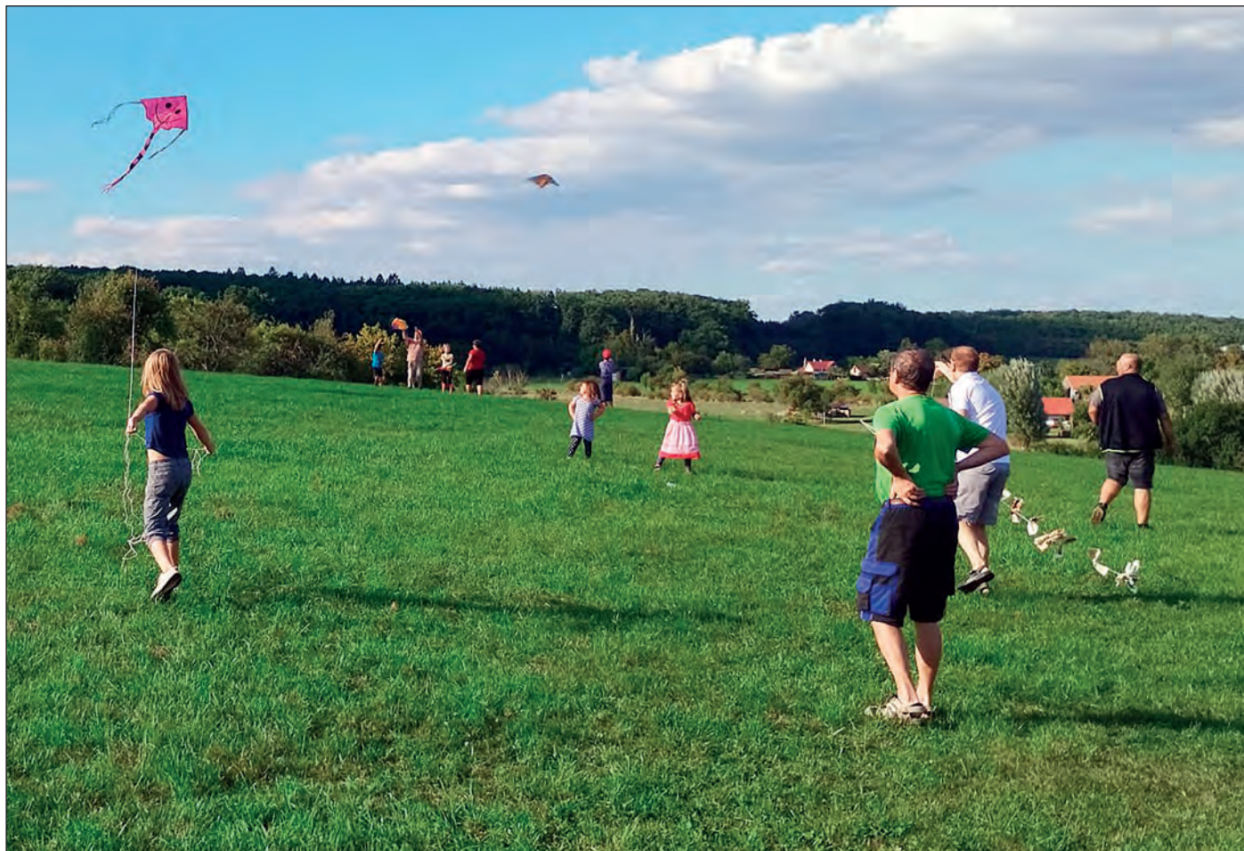
Na Staré Hasině se v sobotu 16. září sešli děti i dospělí při výrobě podzimních dekorací a pouštění draků, a tak o týden později mohl podzim začít