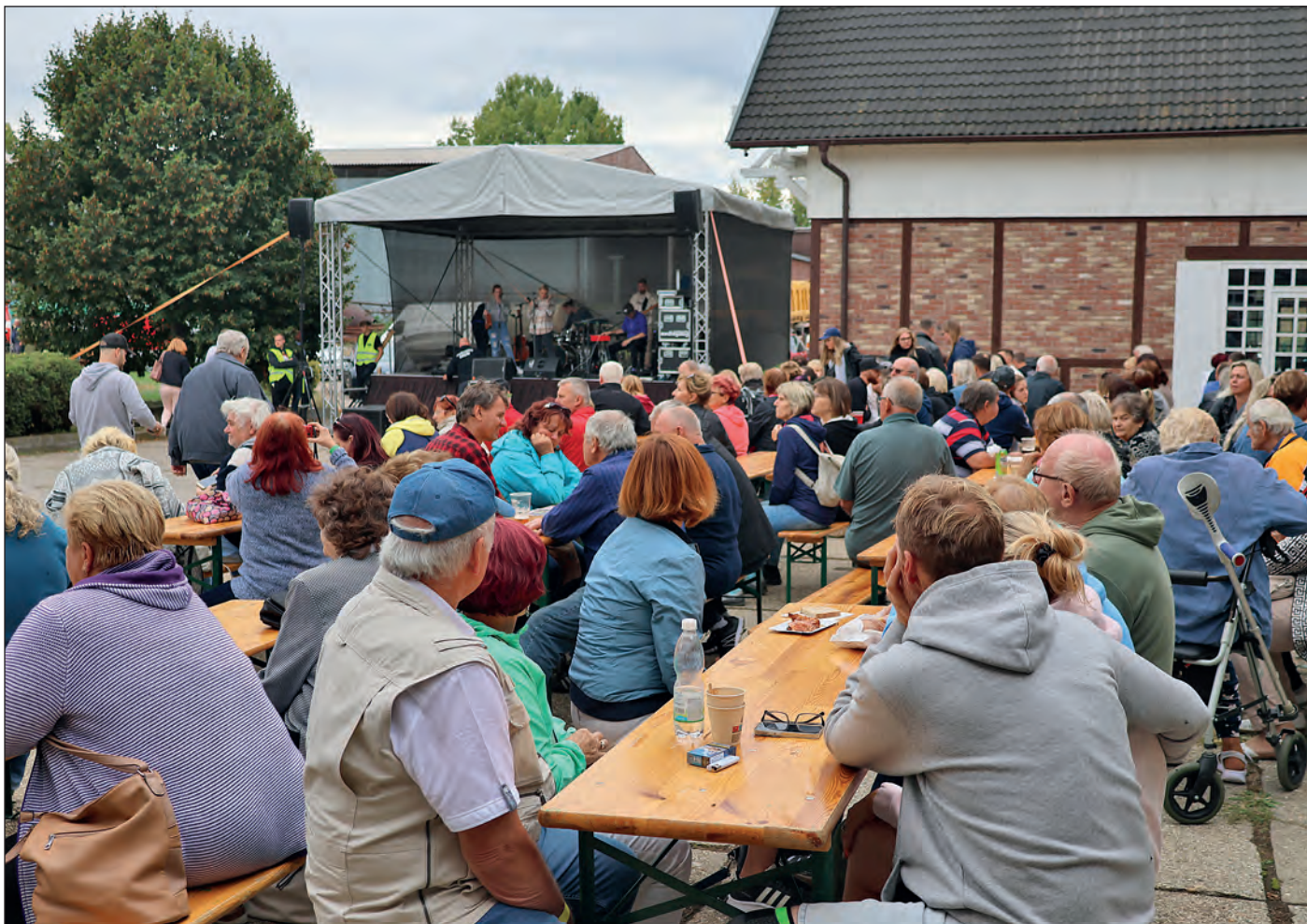
Farma Pojedy hostila v sobotu 23. září tradiční akci Poznejte náš venkov