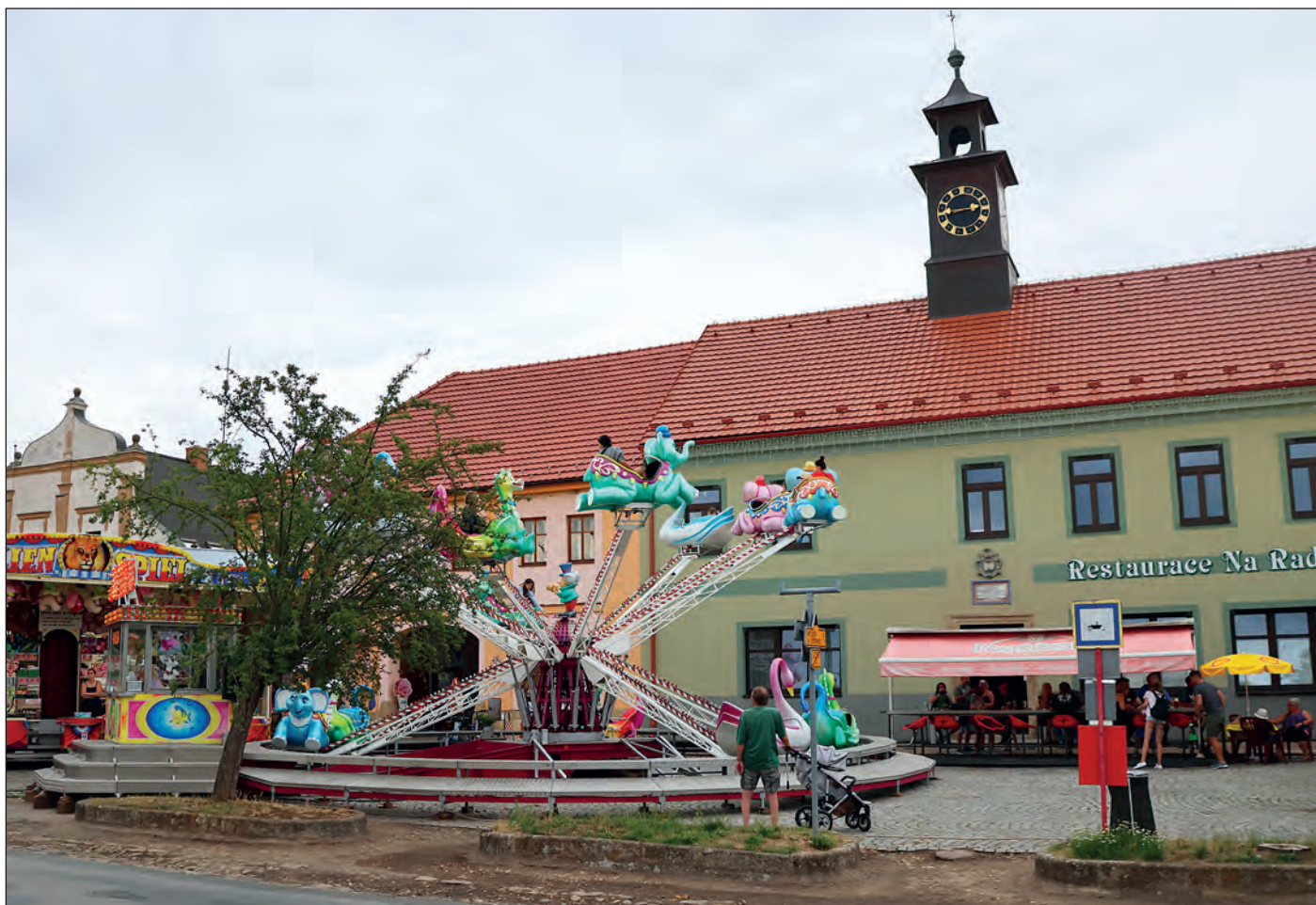
Letošní pouť připadla na neděli 16. července