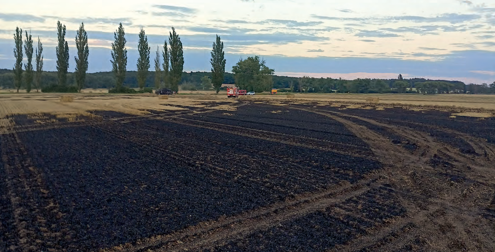
V sobotu 12. srpna zasahovali rožďalovičtí hasiči společně s dalšími jednotkami z okolí u požáru balíkovače, od nějž se následně vžhalo pole o rozsahu 300 x 200 metrů a balíky slámy, které museli rozebrat pomocí ručního nářadí