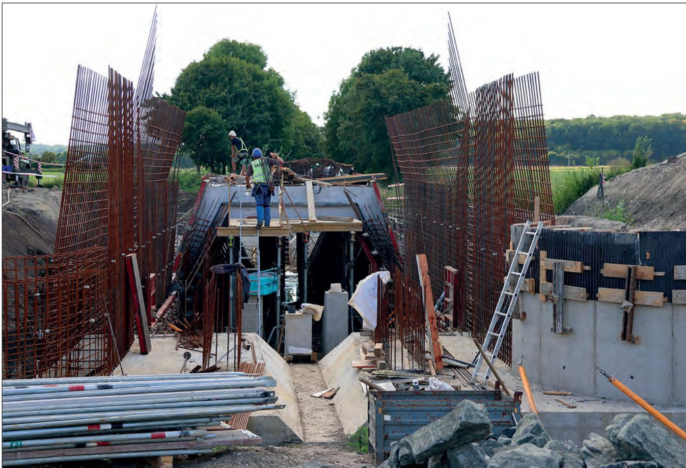
Dva roky by měla trvat výstavba poldru Mlýnec, kterou pro Povodí Labe realizuje od února letošního roku firma Metrostav