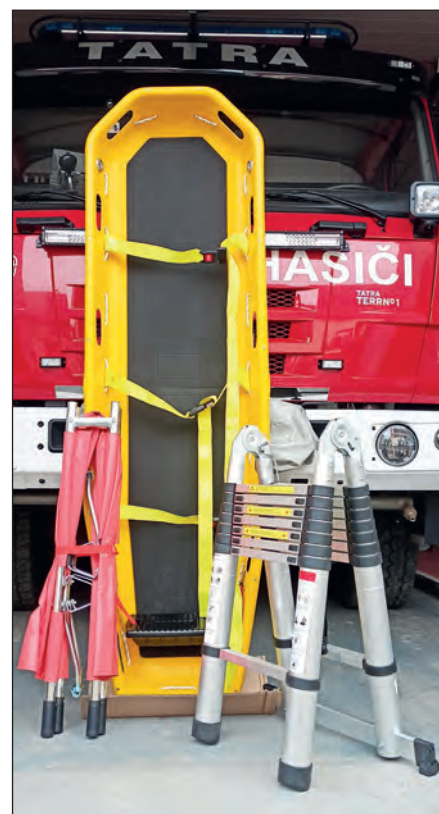
Během léta hasiči díky dotaci ze Středočeského kraje získali transportní vanu, výsuvný žebřík, osm zásahových svítilen, dvě ruční svítilny, dva polohovací jisticí pásy, záchranářská nosítka a defibrilátor do dopravního automobilu – zásahová jednotka také absolvovala kurz první pomoci se zaměřením na jeho použití