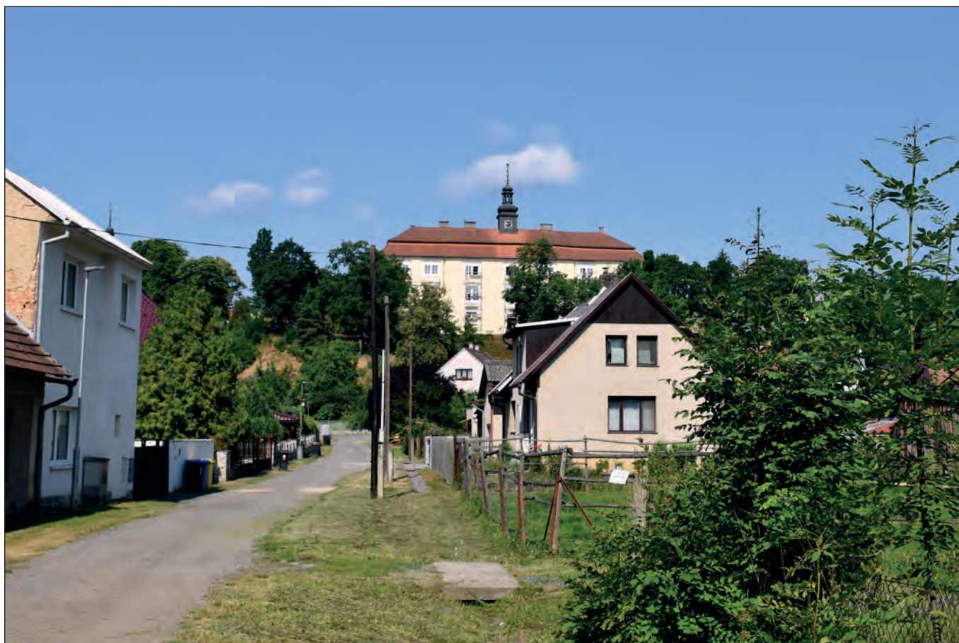
Stejně místo dnes (26. června 2023), foto Viktor Dobrev