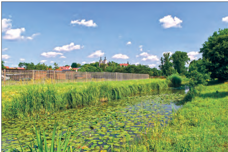
Koncem první červencové dekády se ohlásilo tropické počasí

I v následujícím týdnu jsme se dočkali tropických teplot, slunečného a opět značně větrného počasí s minimem srážek (v pátek 21. července napršelo 5 mm), takže výrazné sucho i nadále přetrvávalo. K jeho částečnému zmírnění přispěly srážky v úterý vpoledne a v noci na středu 26. července (celkem 8 mm). Přechod studené fronty přes naše území do-