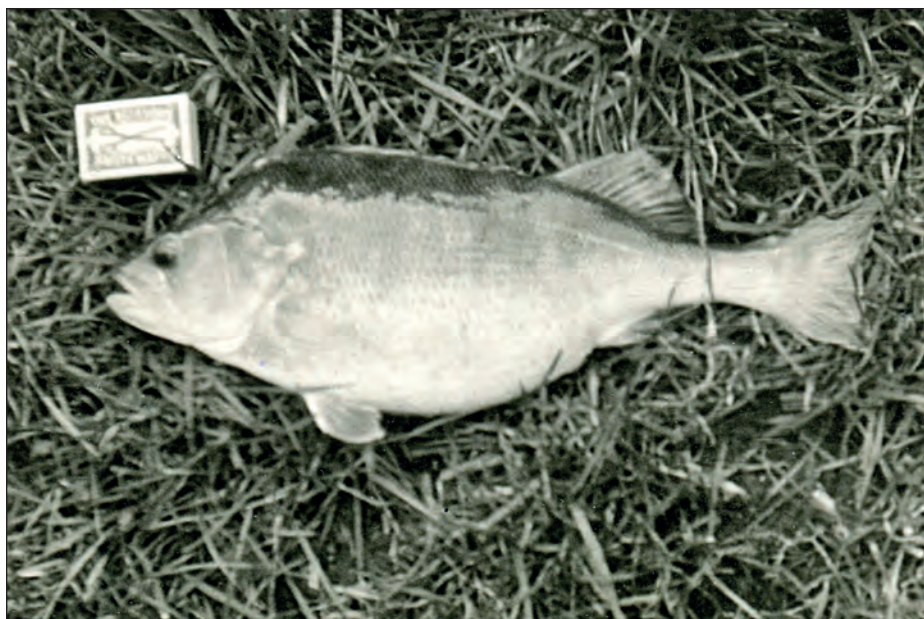
Řeka Mrlina – Rožďalovice Zámostí: okoun 42 cm, váha 1,1 kg, rok 1983

Výborová schůze 28. března rozhodla: Zahájení rybolovu na nově upraveném rybníku pod Křineckou radnicí bude 1. května 1983. Chytá se ve středu, v sobotu a v neděli dle rybářského řádu. Rybník