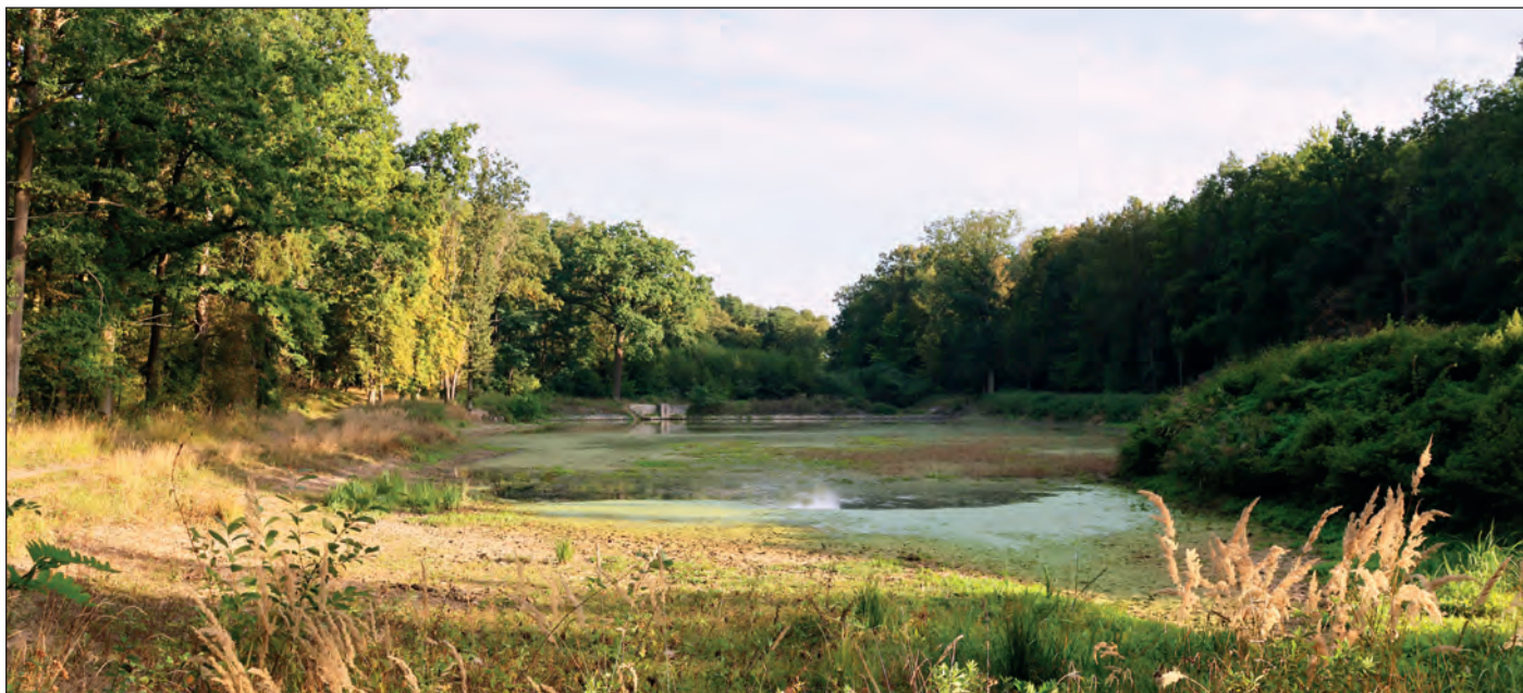
Rybník Kolčánek, 29. září